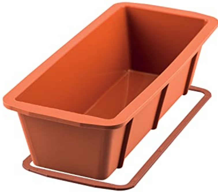
Silikomart 20.326.00.0060 SFT326 Moule Forme Plum-Cake Silicone Terre Cuite