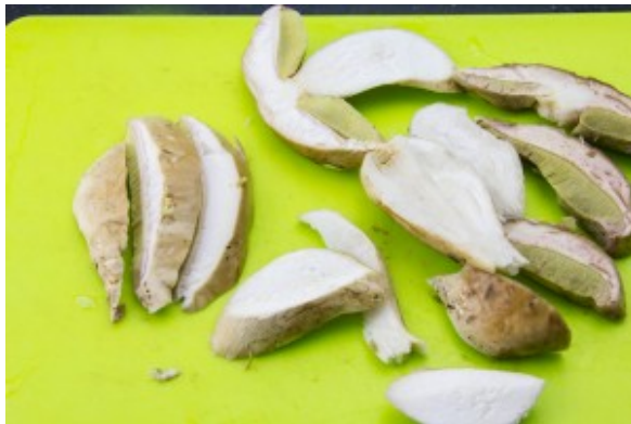
Coupez les cèpes en tranches