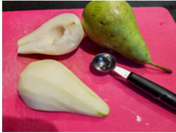
Pelez et évidez les poires