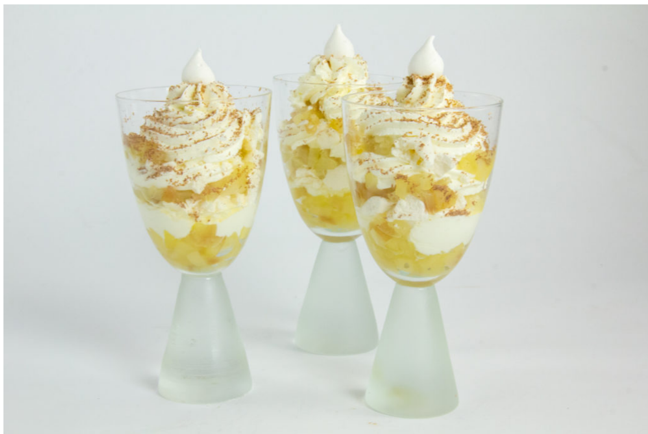
Merveilleuses Poires au romarin

Le romarin est une plante que l'on utilise peu en cuisine et c'est bien dommage. Il amène une saveur très douce et subtile qui se marie particulièrement bien avec tous les fruits: j'aime beaucoup l'utiliser en pâtisserie. Voici donc un de mes desserts maison, facile à réaliser qui va vous enchanter: mes Merveilleuses Poires au romarin.