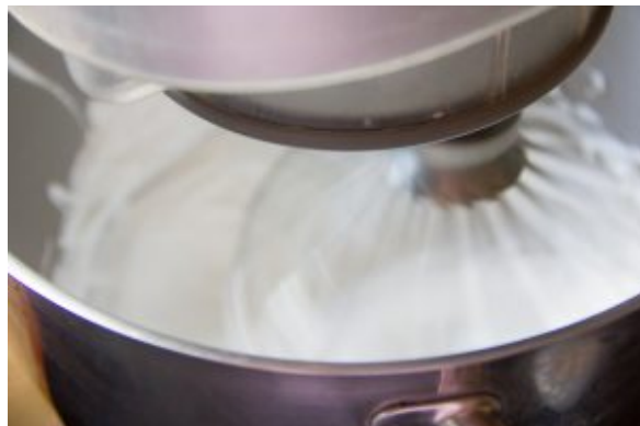
Battez les blancs d'œuf