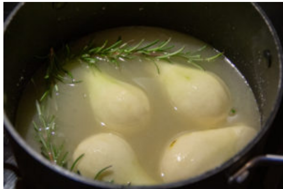
Faites cuire les poires