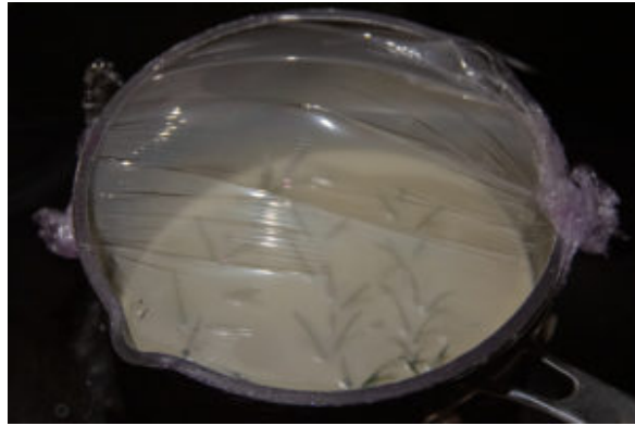
Filmez la casserole

la casserole avec du film alimentaire. Laissez retomber en température et mettez au frais pour la nuit.