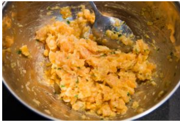
Mélangez tous les ingrédients du tartare sauf les œufs de saumon