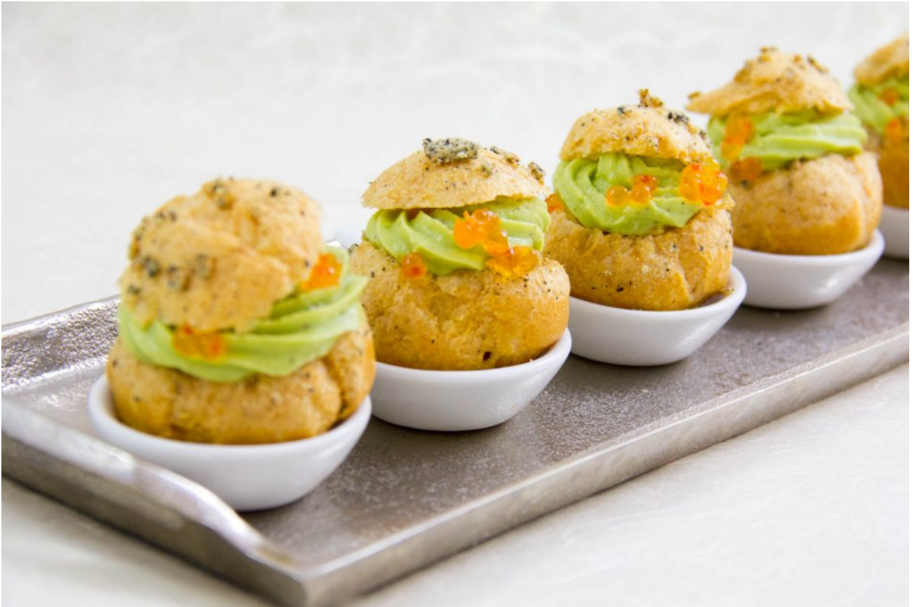
Choux apéro, tartare de saumon et guacamole