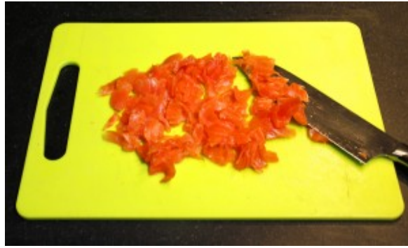
Coupez les saumon