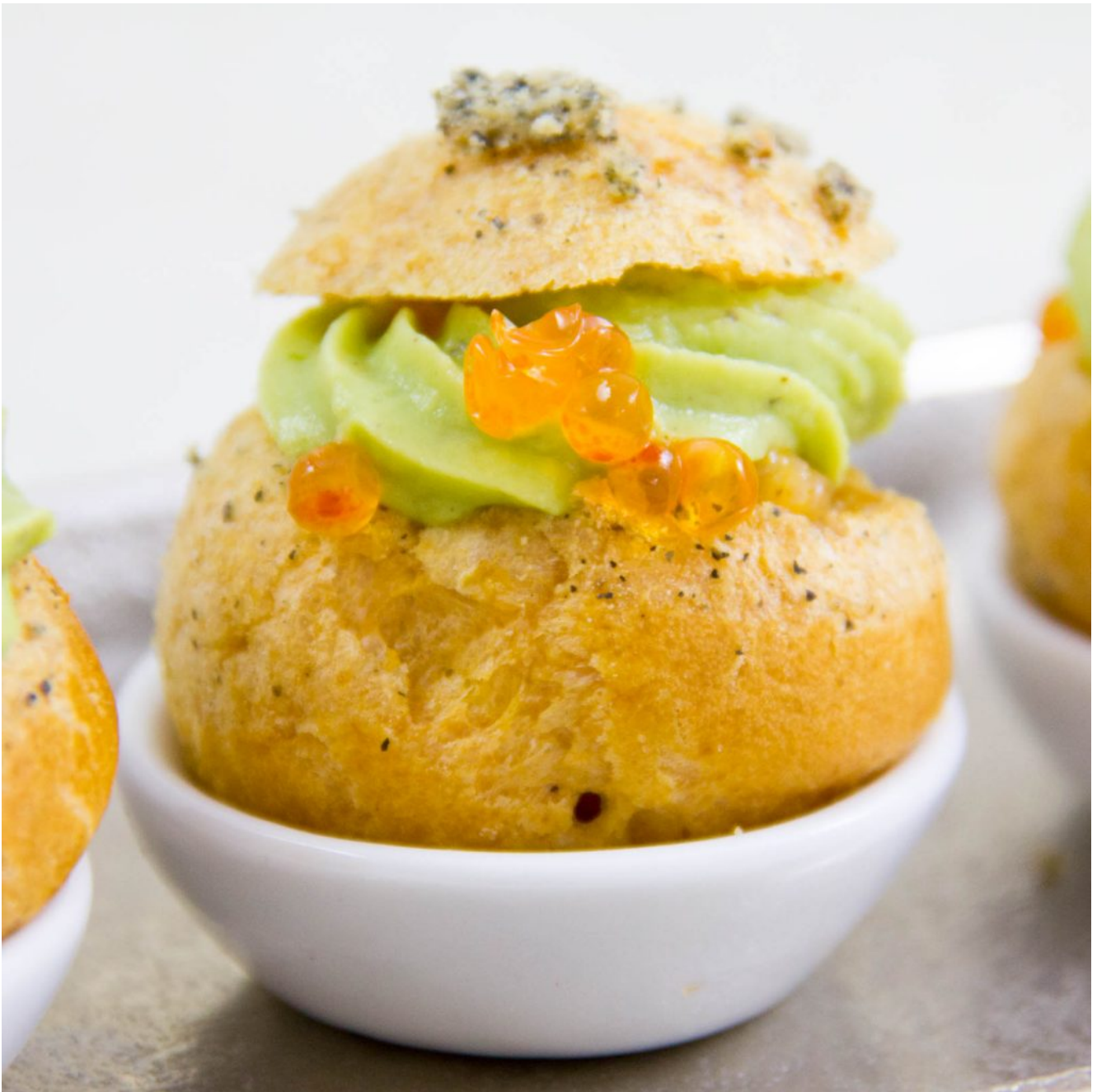
Choux apéro au tartare de saumon et guacamole