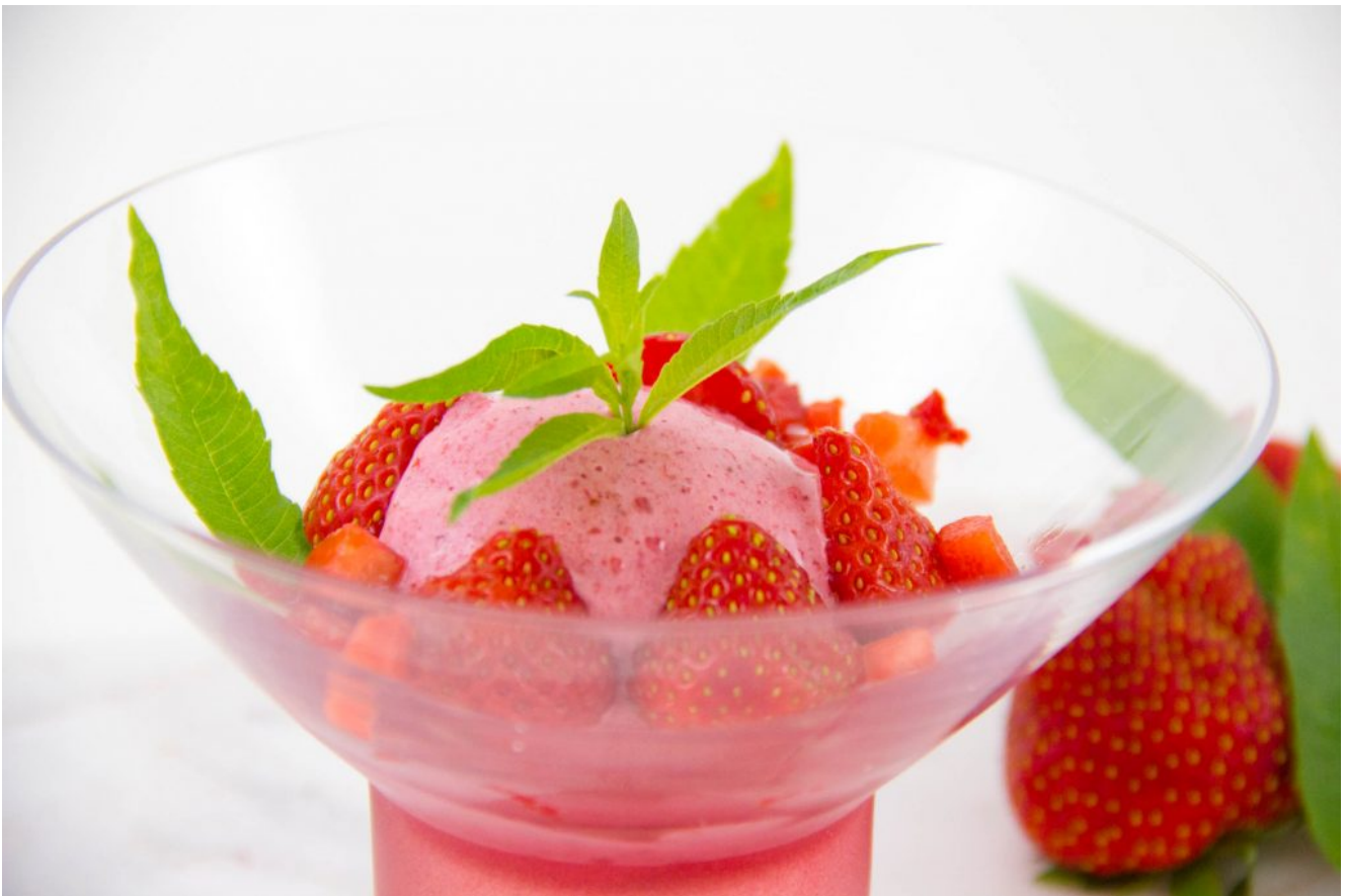
Sorbet fraise verveine

En ce weekend de canicule un peu de fraîcheur avec ce délicieux sorbet fraise verveine! Sa texture crémeuse étonnante vous ravira car elle ressemble à celle des glaces italiennes. La recette est simplissime: vous n'aurez pas besoin de sorbetière mais cela demande l'aide d'un mixeur de qualité.