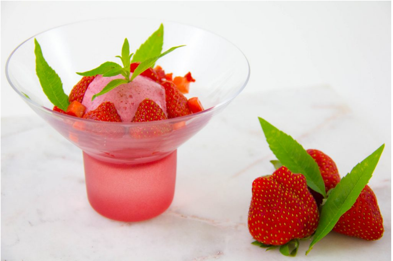
Sorbet fraise verveine