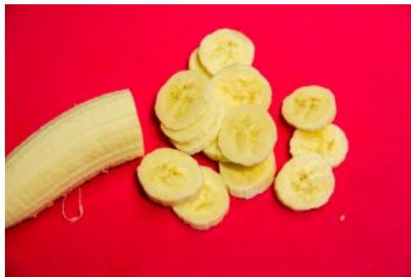
Coupez les bananes en fines rondelles