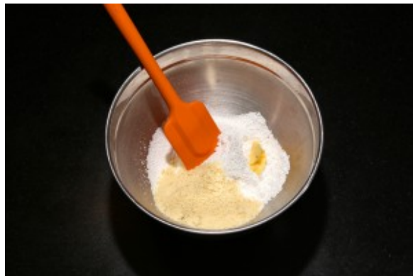
Sucre, poudre d'amande, beurre