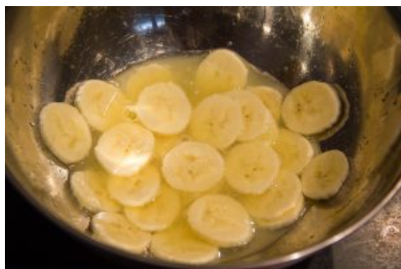
Déposez les bananes au fur et à mesure dans le jus de citron