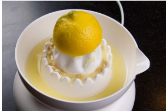
Pressez le jus du citron