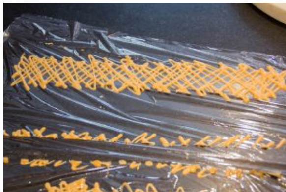
Puis quadrillez la bande de rhodoïd avec le chocolat