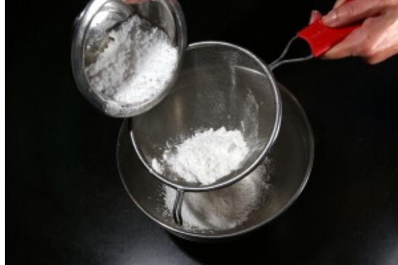
Tamisez le sucre glace