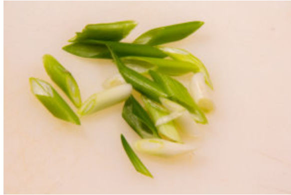
Ciselez les oignons jeunes