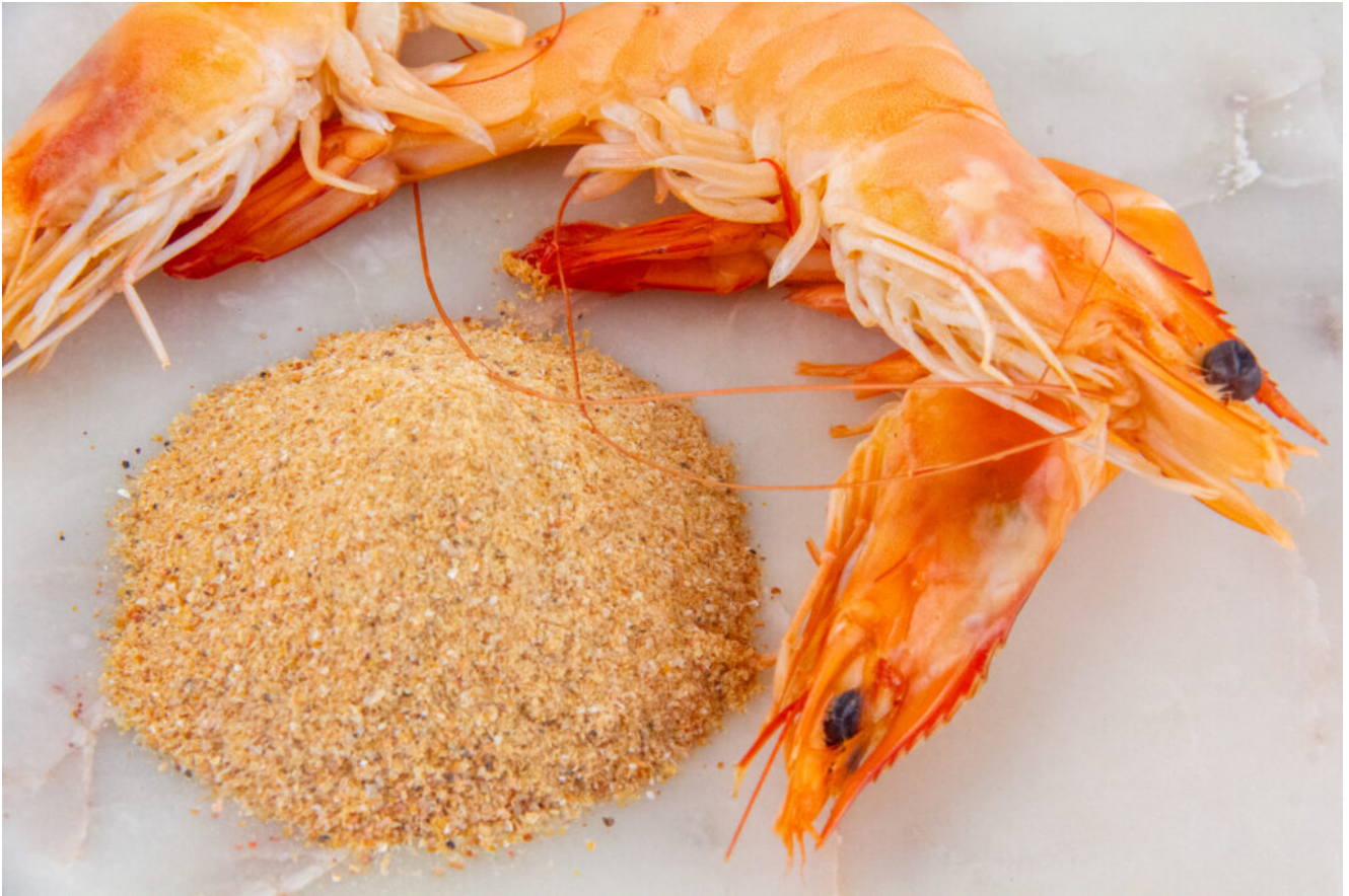
Poudre de crevette maison