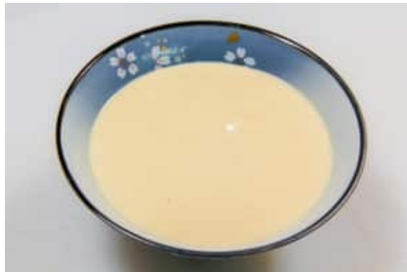
Préparez la sauce