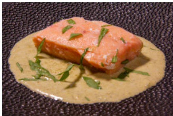
Saumon à l'oseille (recette Thermomix)