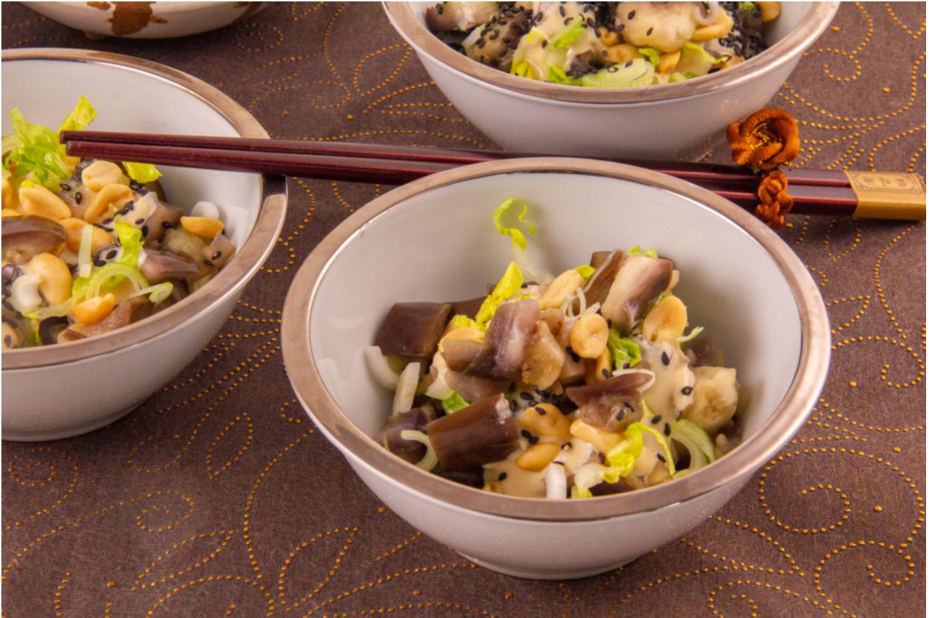
Salade Japonaise aux aubergines