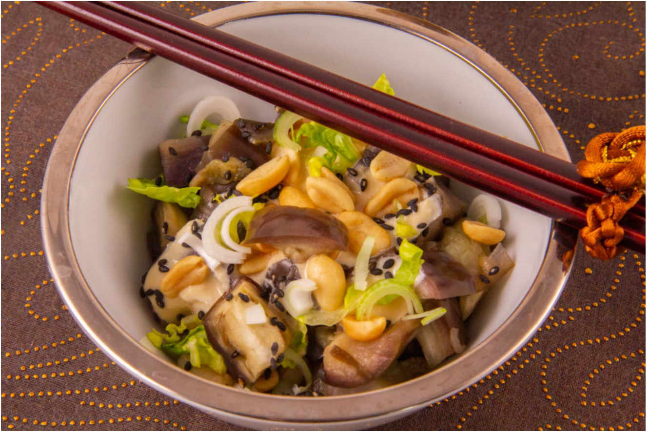
Salade Japonaise aux aubergines