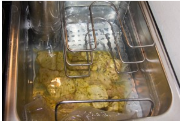
Cuire la viande sous vide

Pendant cette cuisson longue de la viande préparez vos légumes et la graine de couscous. Pour la graine: