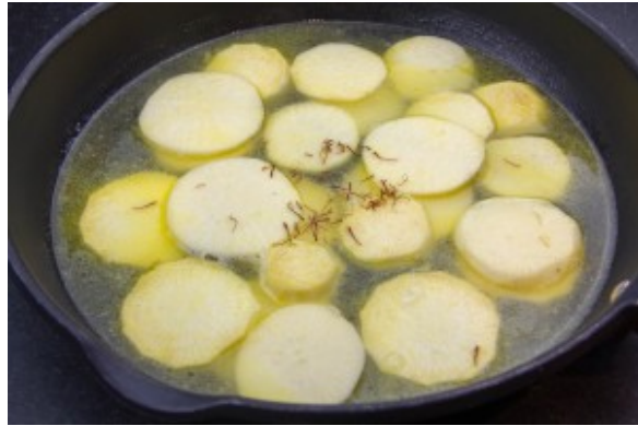
Cuire les navets à feu doux