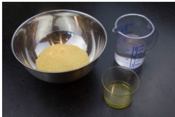
Mélangez la graine avec l'huile