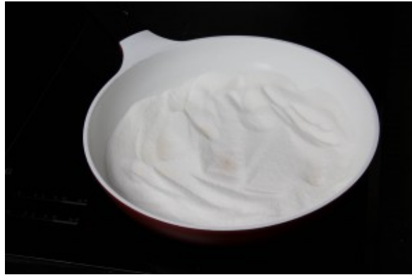
Faire un caramel