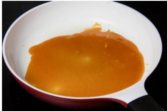
Retirez le caramel du feu