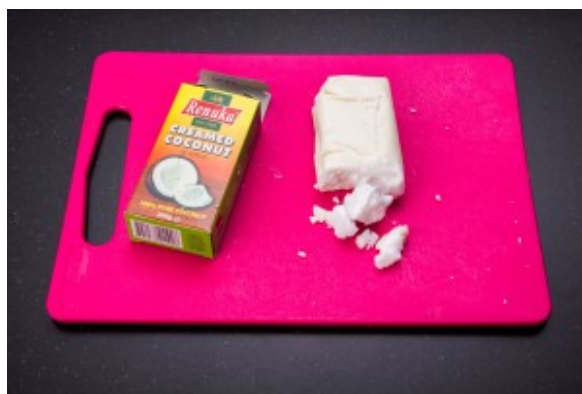
la crème de coco