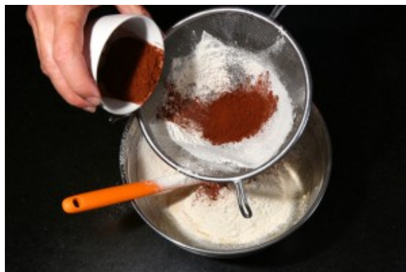
Tamisez la farine, le cacao