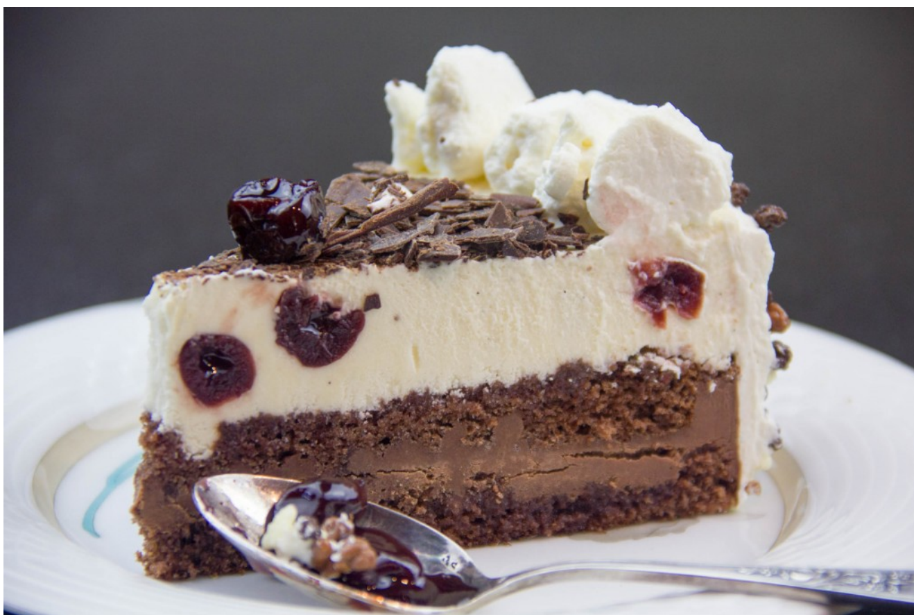
La forêt noire

C'est la meilleure que j'ai réalisée donc je vous en livre aujourd'hui les secrets.