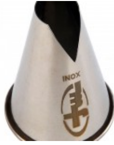
douille saint- honore