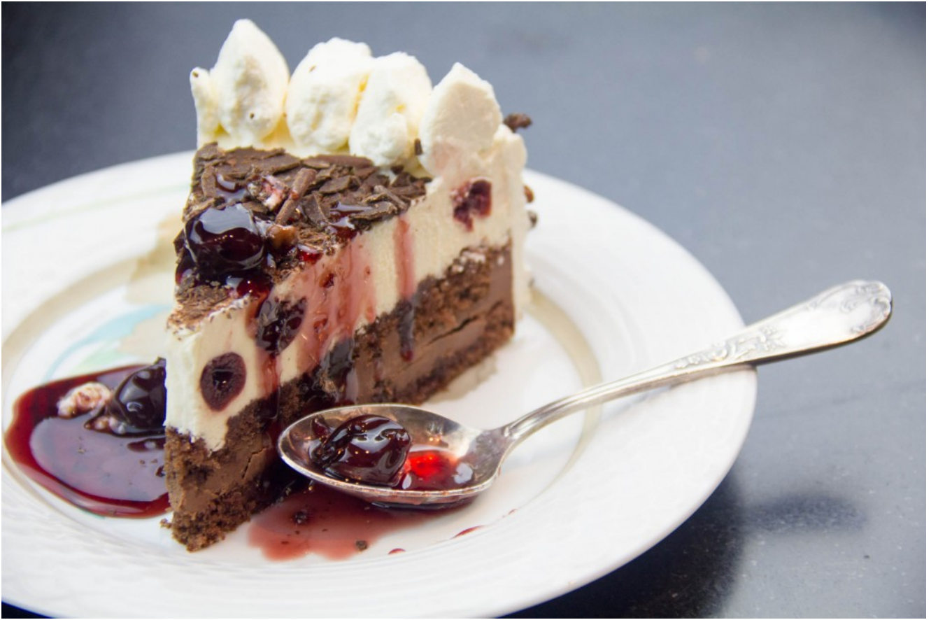
La forêt noire