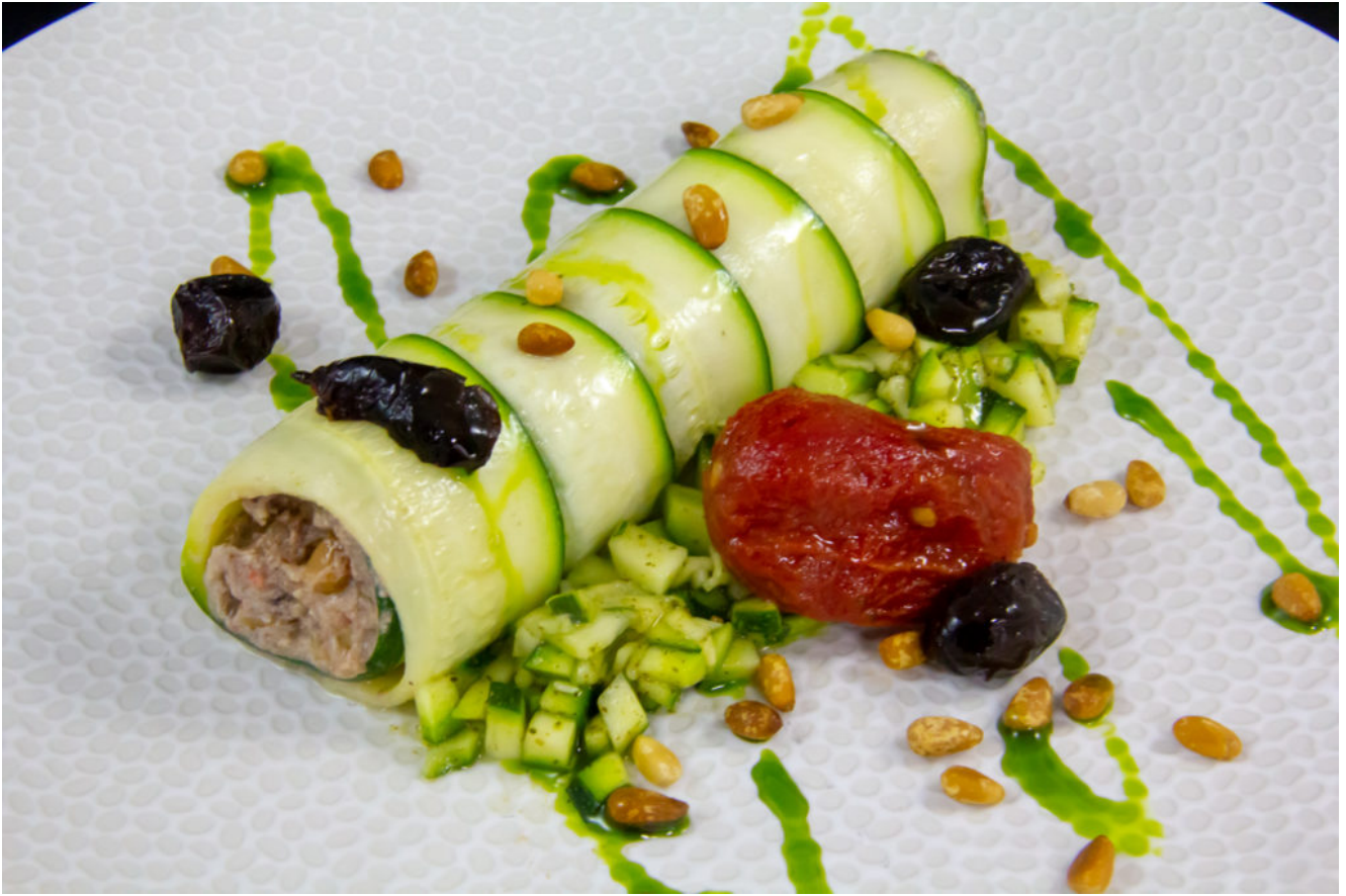
Roulé de courgette