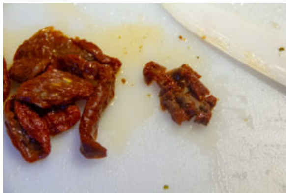
Coupez les tomates confites en petits morceaux