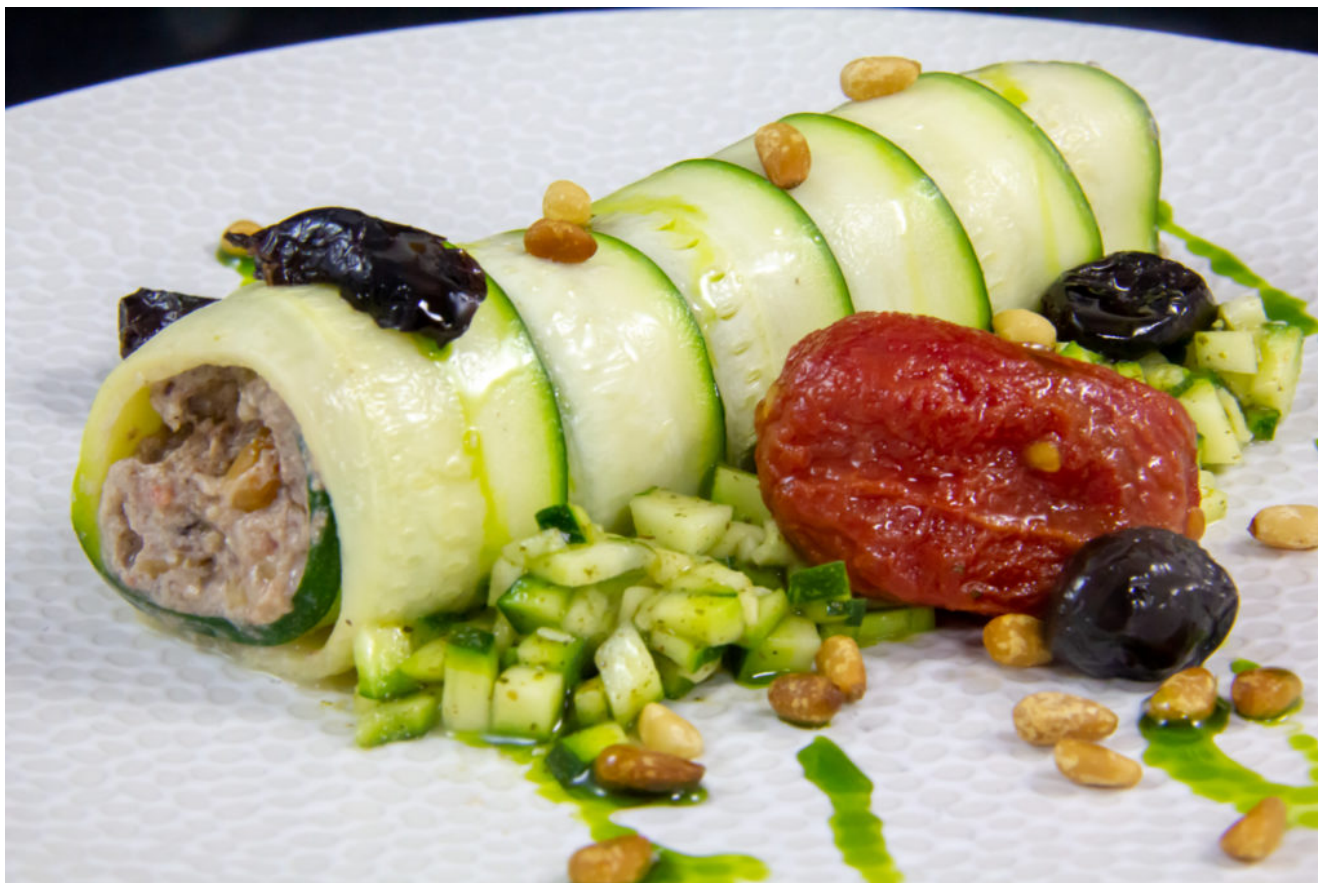
Roulé de courgette aux olives

Un roulé de courgette tout en fraîcheur pour une belle table ensoleillée et surtout une très belle dégustation végétarienne, riche en saveur, comme je les aime!