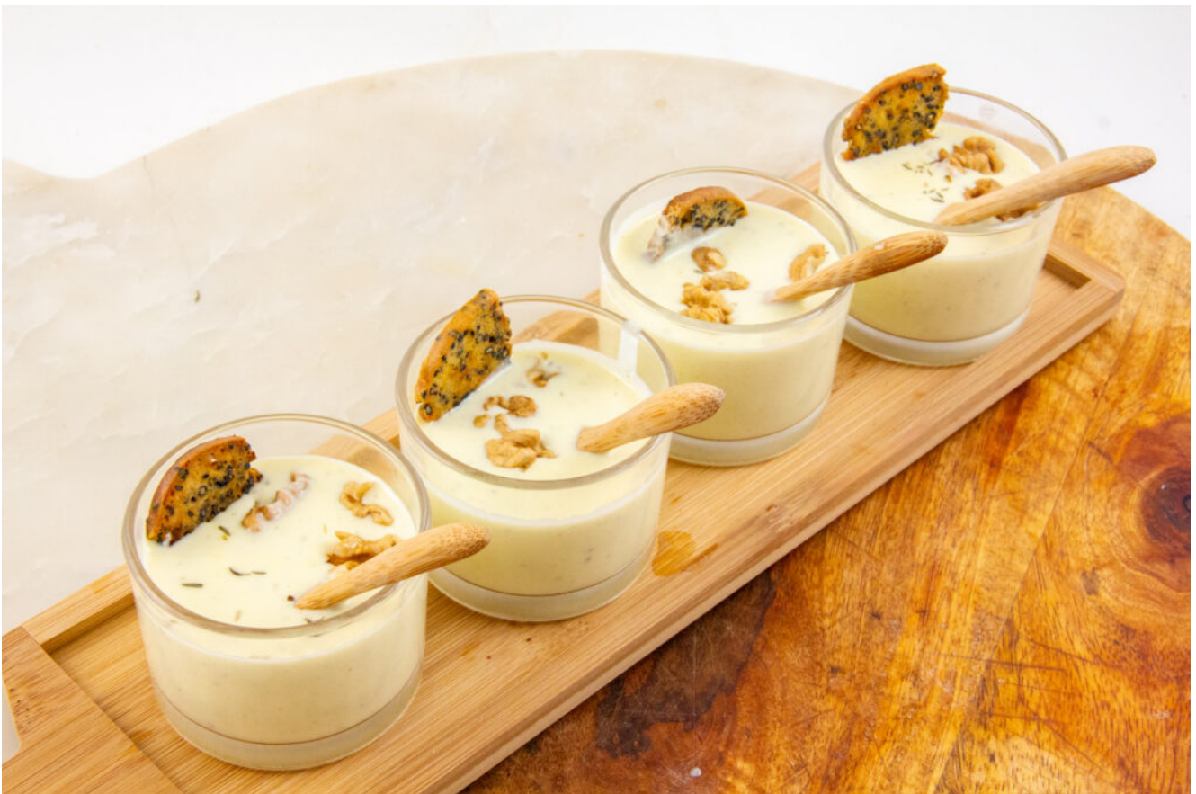
Crème de reblochon au thym