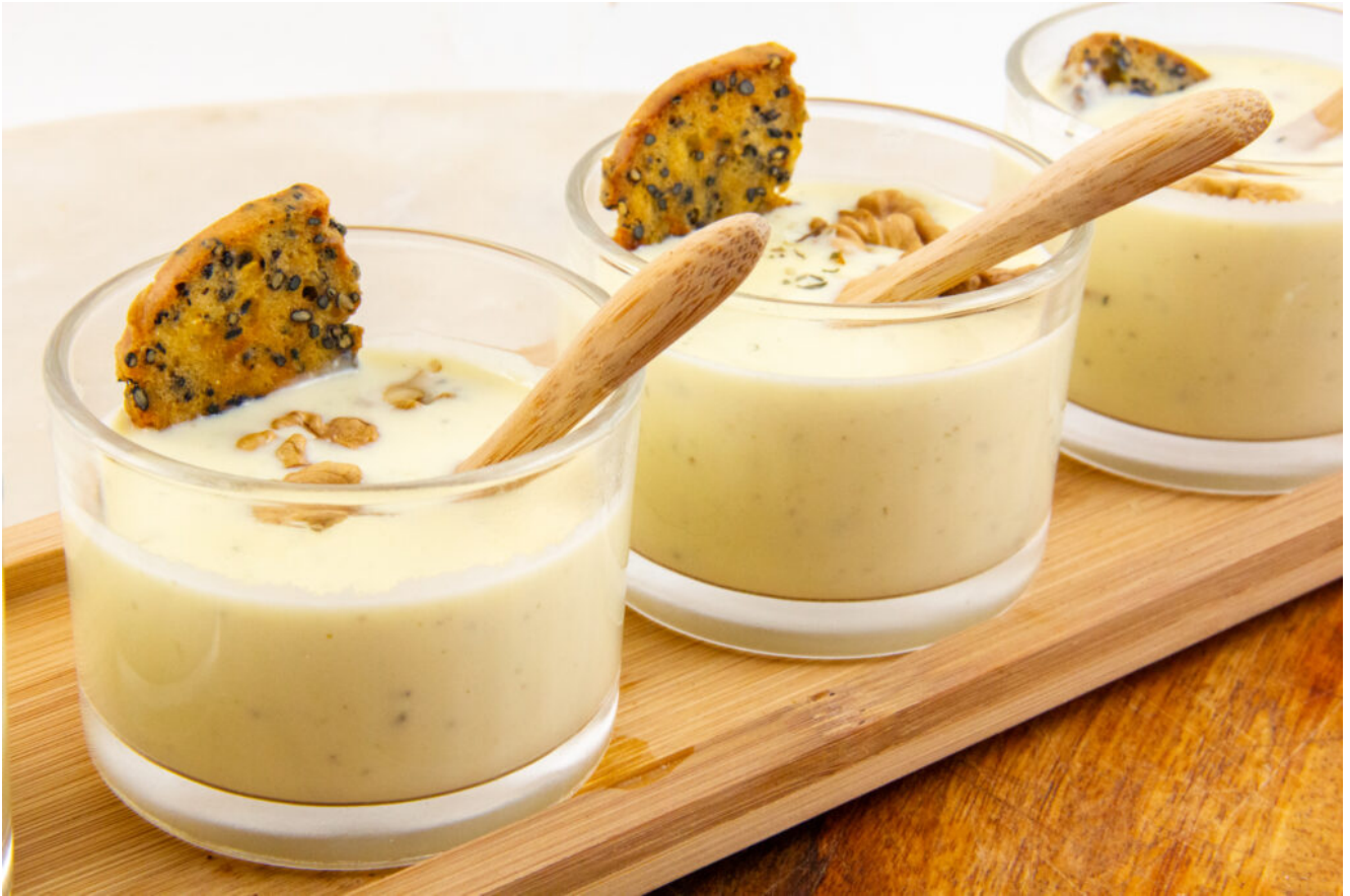
Crème de reblochon au thym