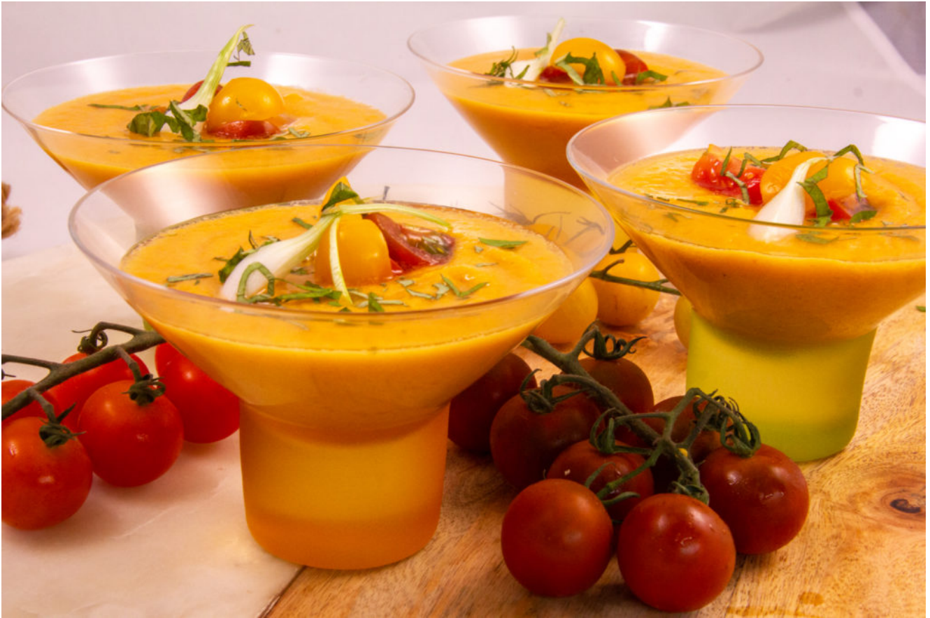
Gaspacho Melon concombre, chips de bacon