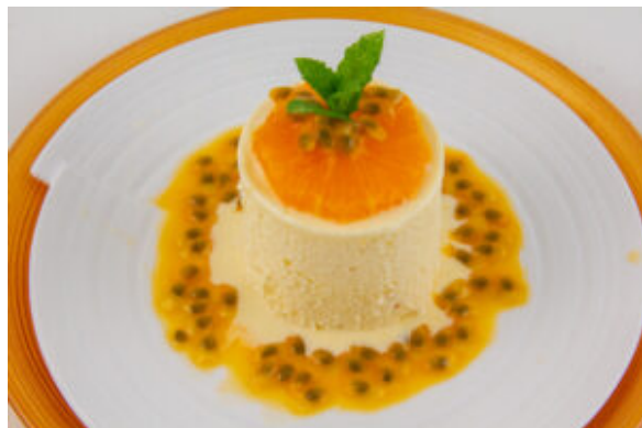
Soufflés glacés à la mandarine

Enfin d'autres suggestions que vous pourrez trouver sur le blog! Je vous ai fait une sélection gourmande de plats festifs. Pour accéder aux recettes suivantes cliquez sur le nom de la recette: