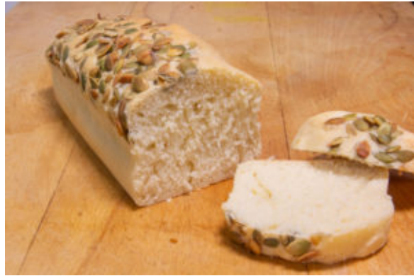
Pain nuage Thermomix