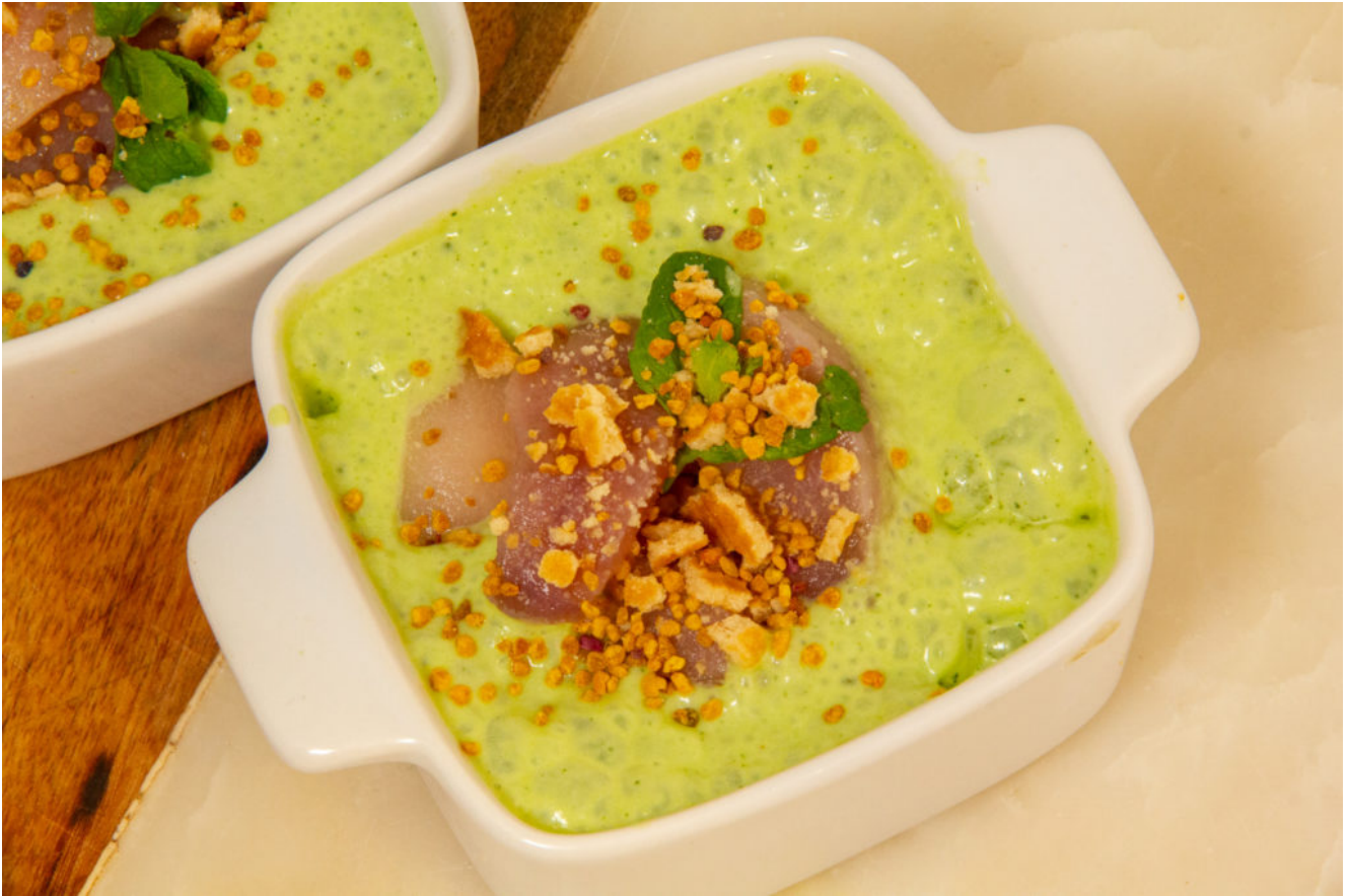
Pêches, petits pois menthe en dessert