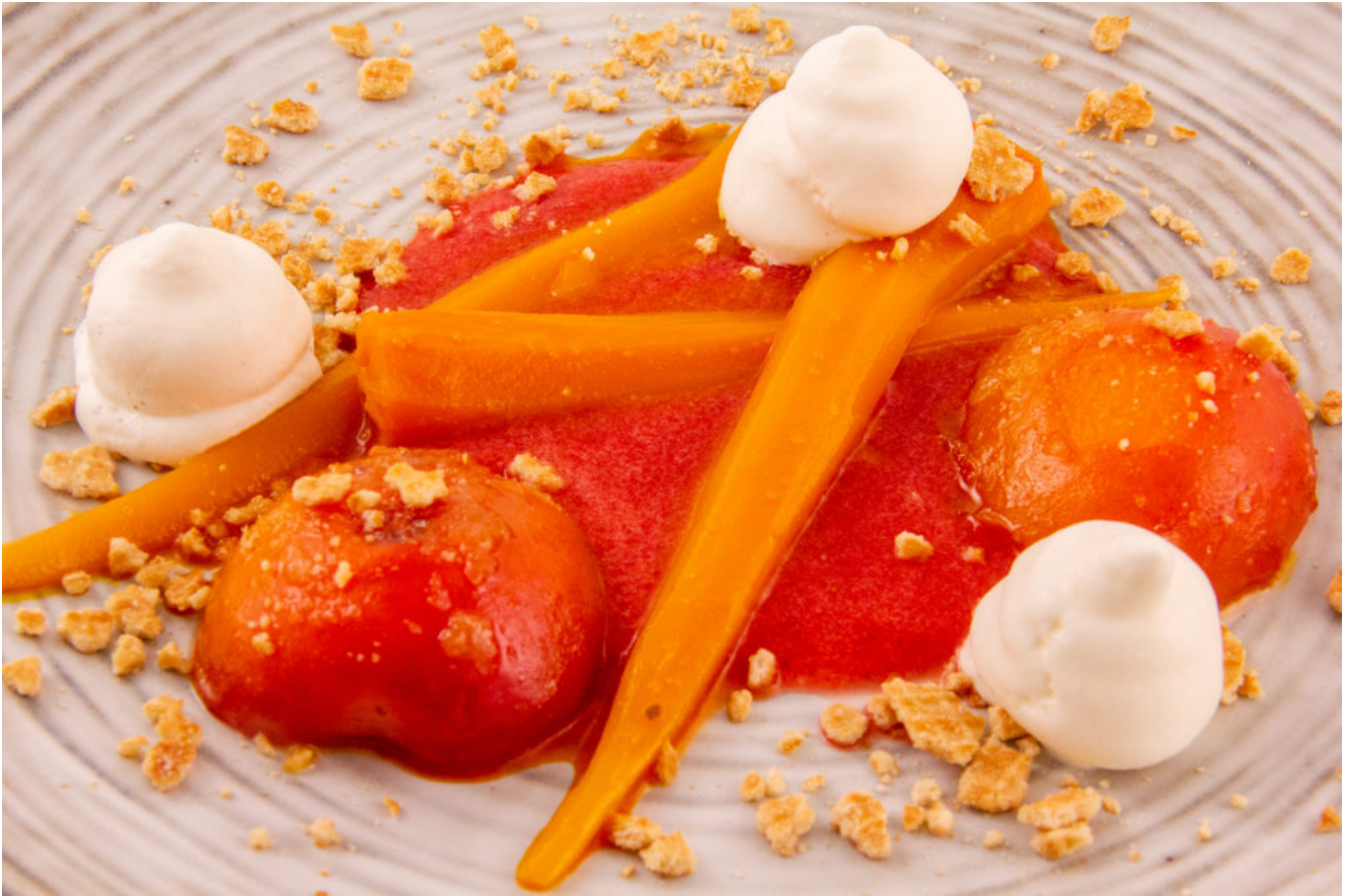
Carotte et abricot en dessert