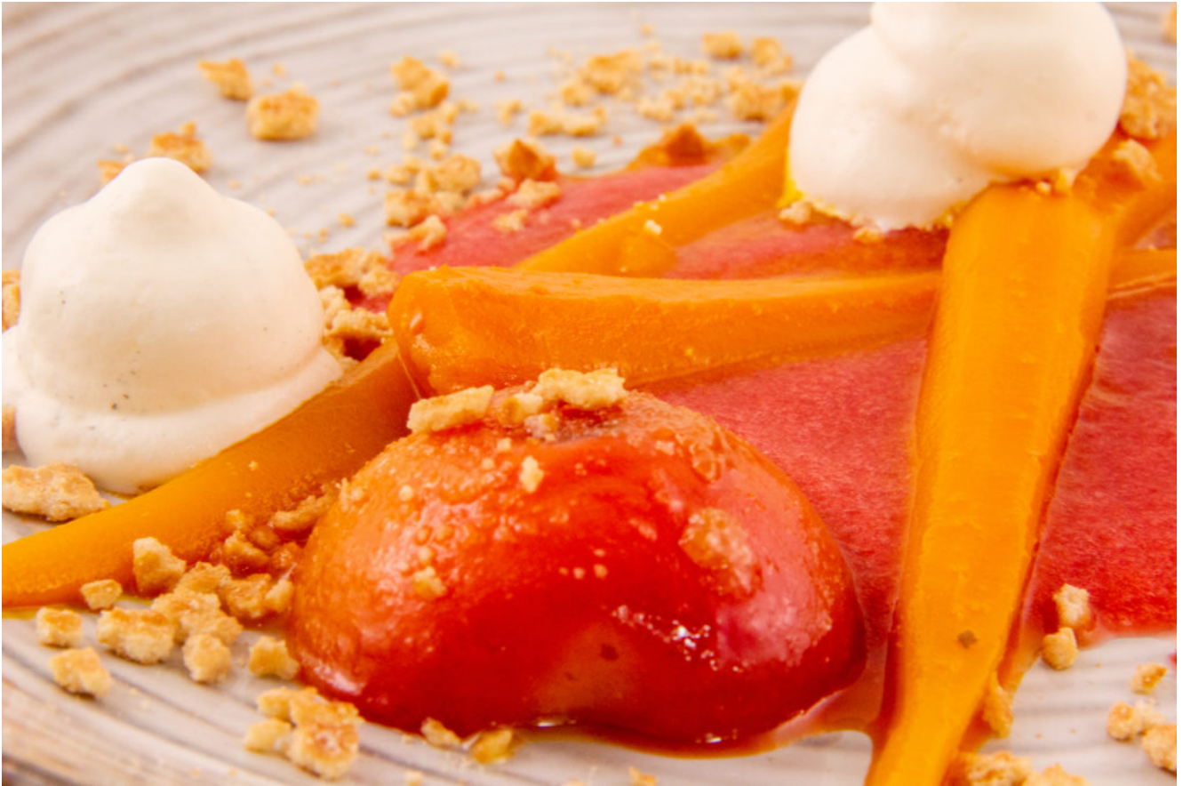
Carotte et abricot en dessert