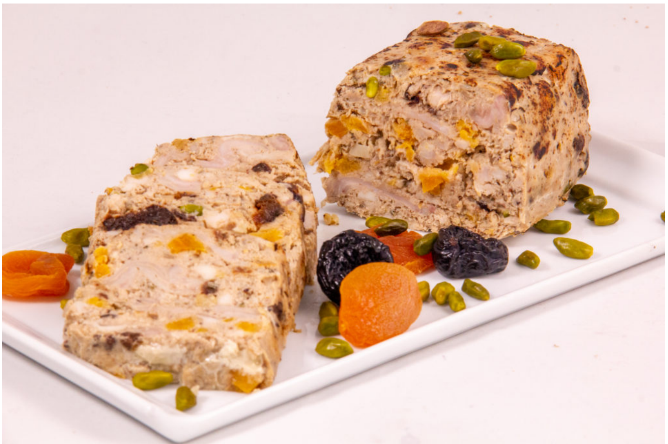
Terrine de lapin aux fruits secs ( Recette basse température)