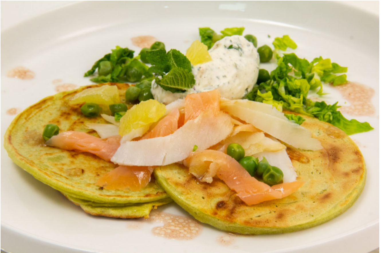
Pancakes aux petits pois, saumon et sauce menthe