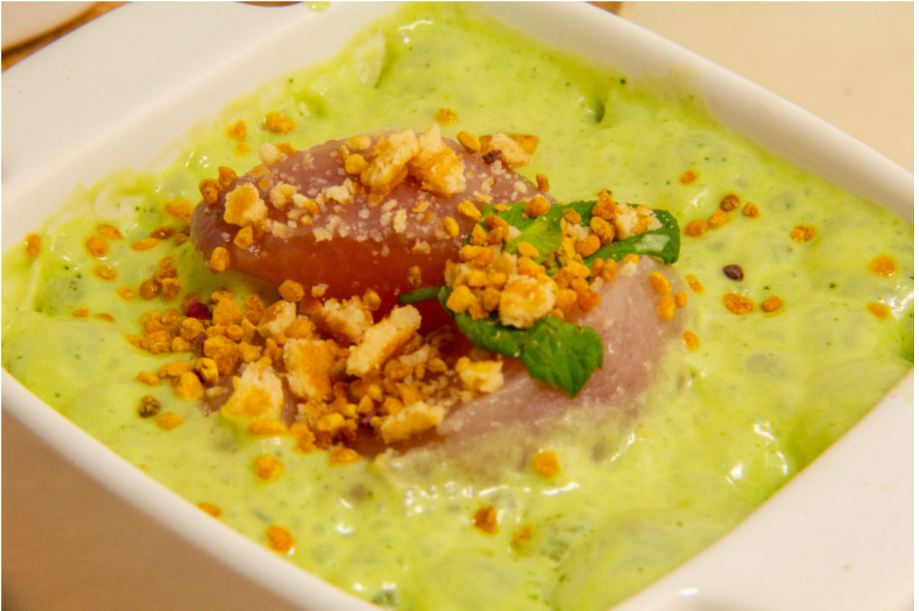
Pêches, petits pois menthe en dessert