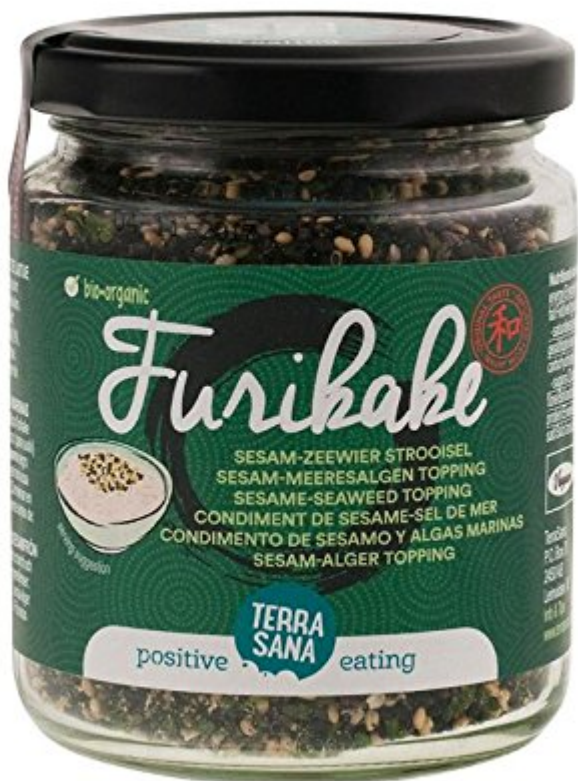
Furikake 100 g