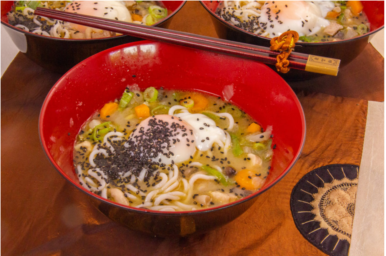
Butajiru ou soupe Japonaise et son Œuf Basse température