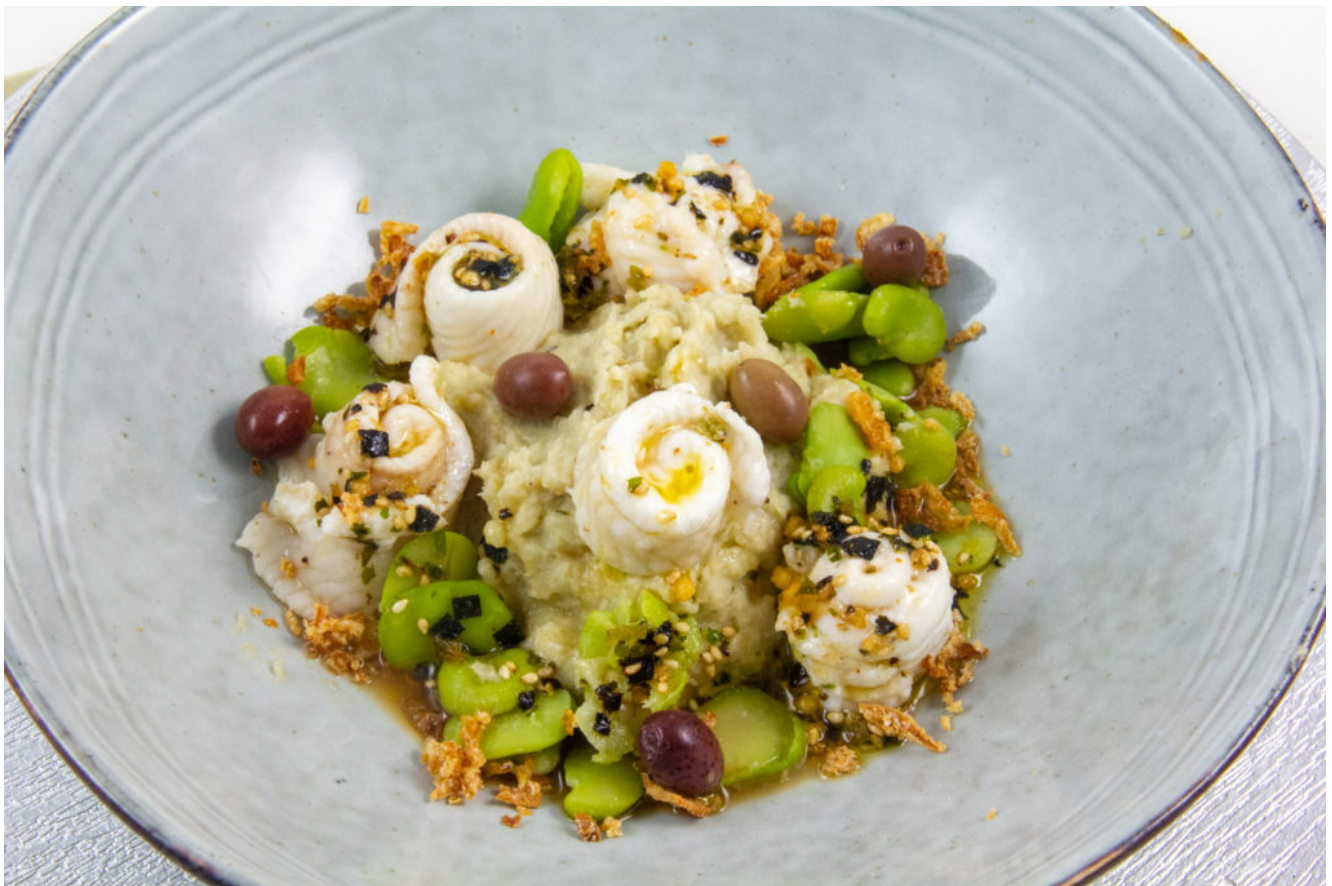
sole, artichaut, feves