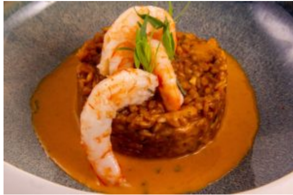
risotto d'épautre aux crevettes (Thermo)