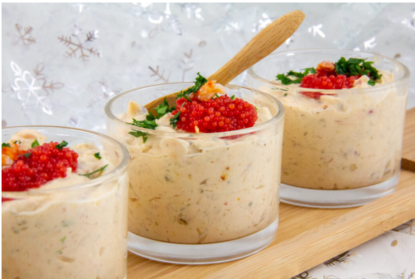
Verrine crabe et saumon

Pour la recette adaptée au Thermomix cliquez ici