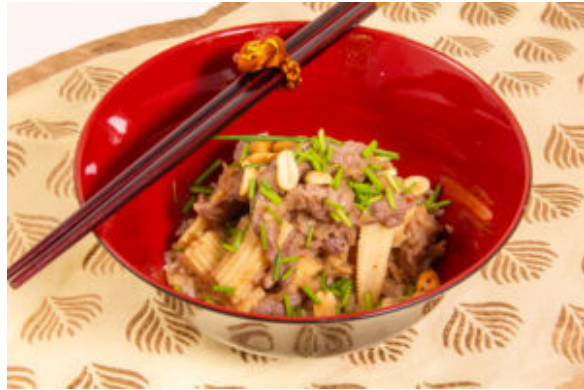
Boeuf aux cacahuètes (recette Thermomix)