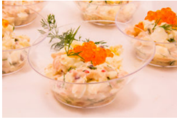
Verrine saumon fumé à l'aneth (thermomix)

En entrée: Cappuccino de pomme de terre, champignon et foie gras (la recette sera publiée le 8 décembre)