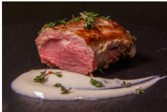
Agneau et sa crème d'ail (Recette TM6, cuisson sous vide)