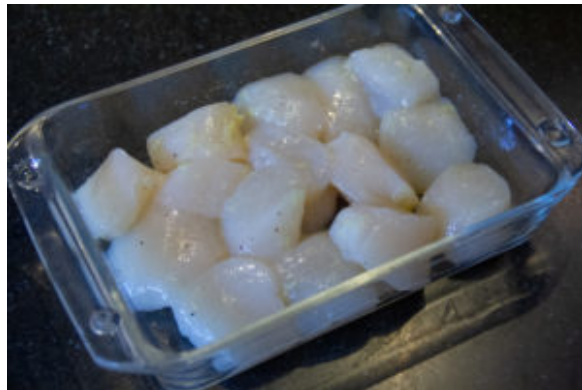
Faites mariner les Saint Jacques