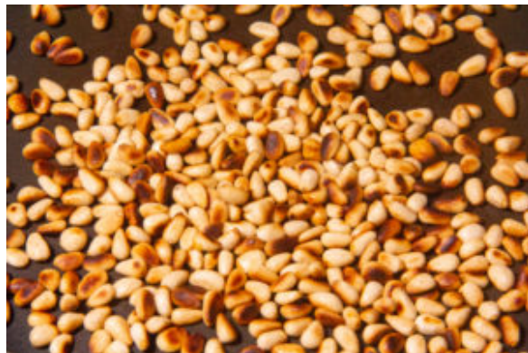
Faites dorer les pignons