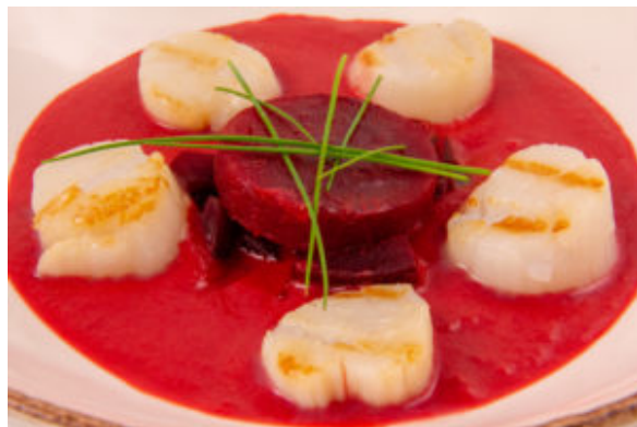
Saint Jacques en habit rouge

En plat: Saint Jacques en habit rouge (recette basse température) (la recette sera publiée le 15 décembre)