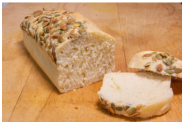
Pain nuage Thermomix