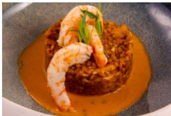
risotto d'épautre aux crevettes (Thermo)

Et quelques recettes personnelles réalisées grâce à ce petit génie de la cuisine: