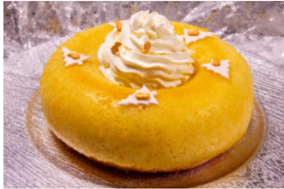
Baba de Pâques (recette Thermomix)