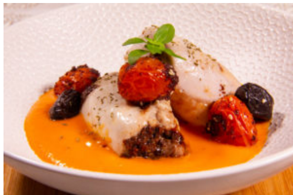
Poulet provençal (recette Thermomix)