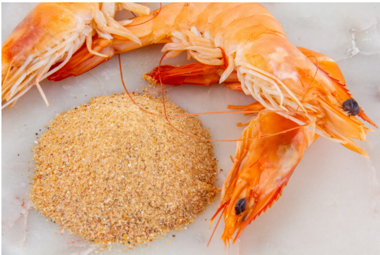
Poudre de crevette maison

Pour la recette au Thermomix cliquez ici .