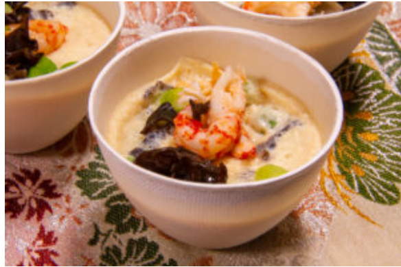
Chawanmushi ou petits flans salés japonais (recette Thermomix)