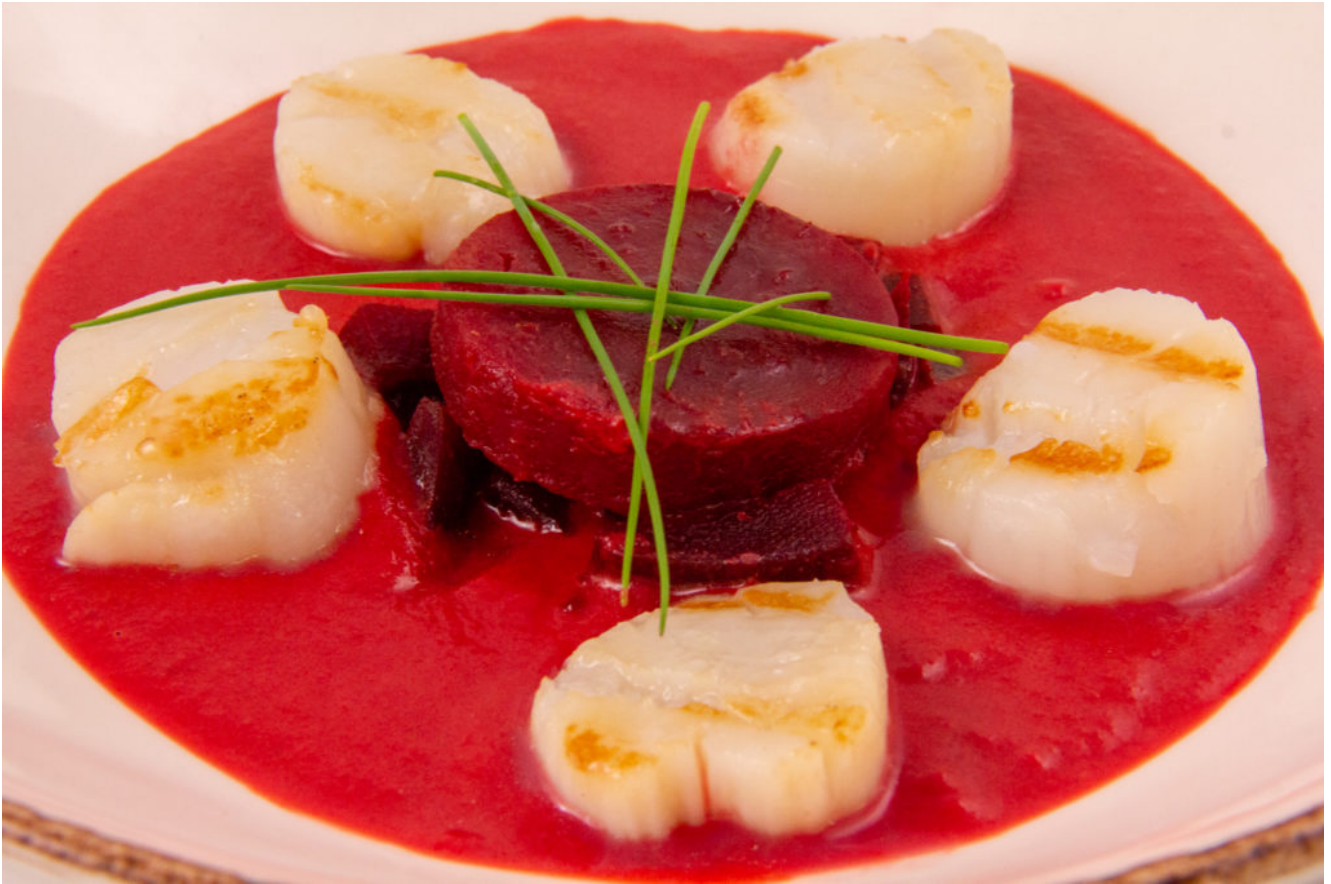
Saint Jacques en habit rouge