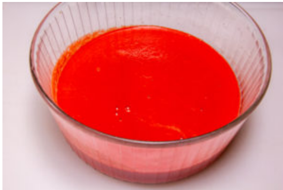
Mixez les betteraves