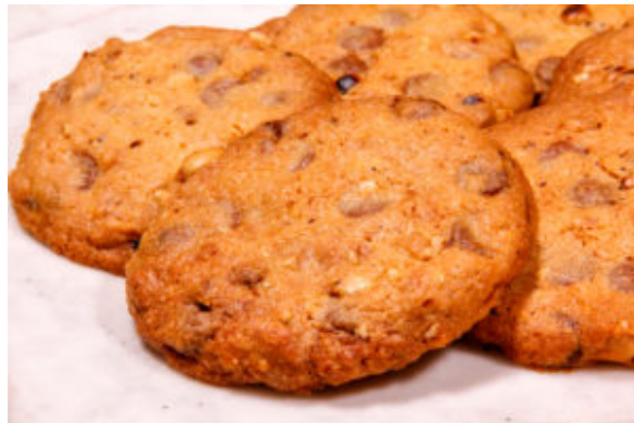
Cookies chocolat et cacahuètes (Recette Thermomix)s