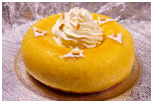
Baba de Pâques (recette Thermomix)