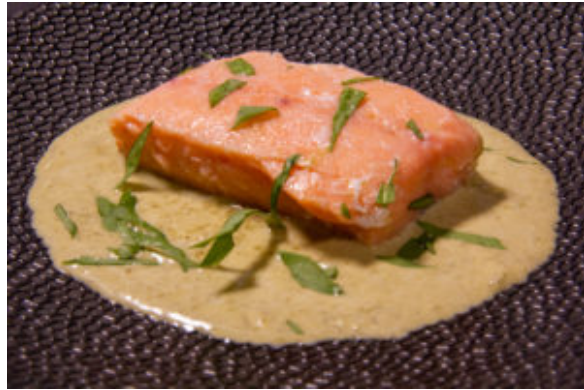
Saumon à l'oseille (recette Thermomix)