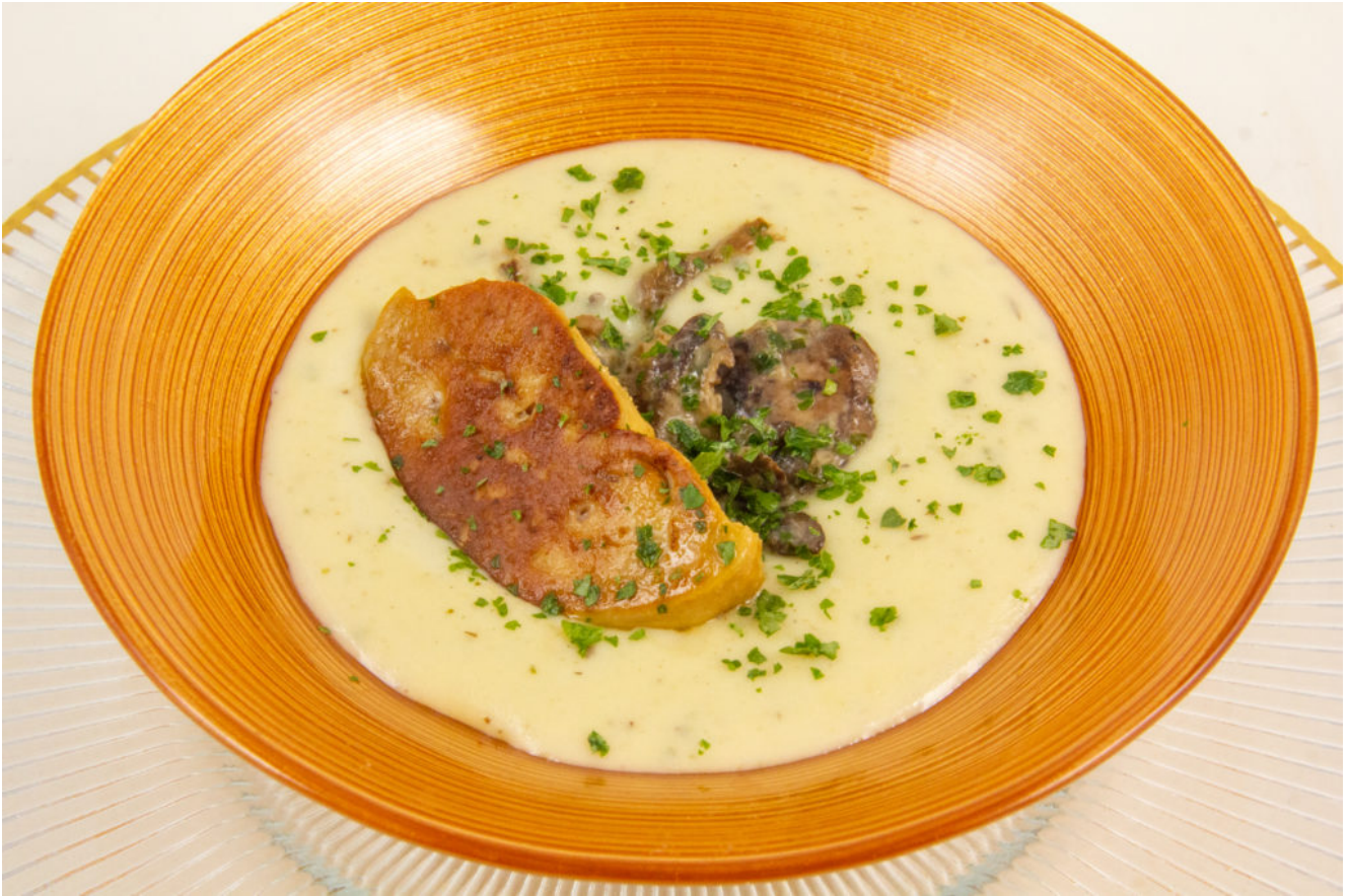
Cappuccino Pommes de terre, champignons et foie gras