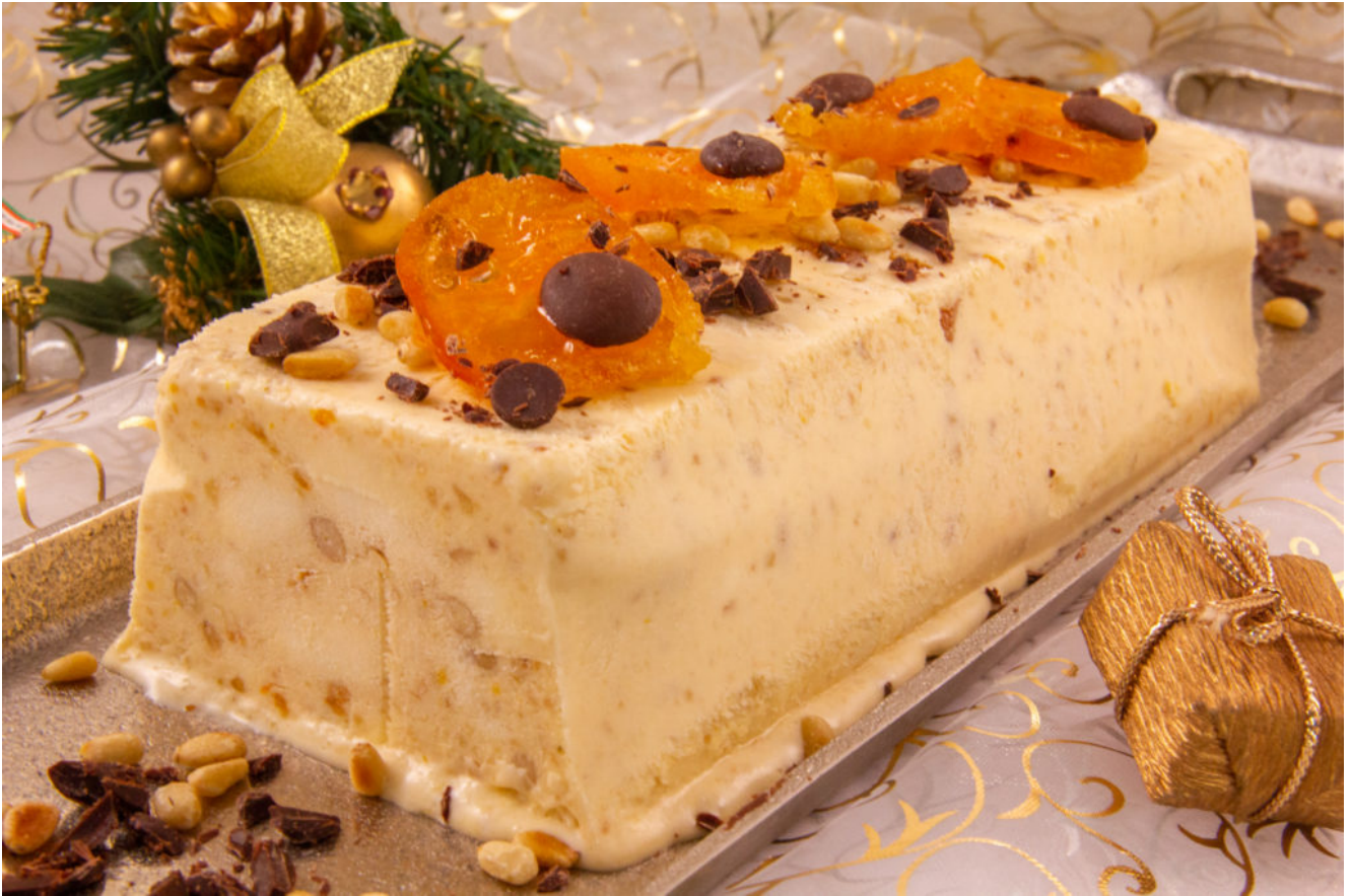
Nougat glacé mandarine pistache ou Nougat de Noël