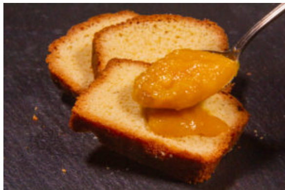
Crème d'abricot romarin (recette Thermomix)