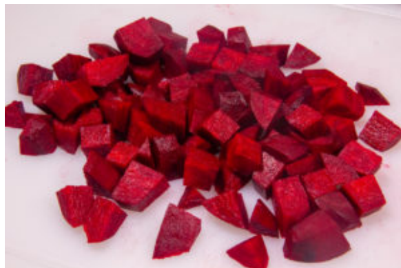
Coupez les betteraves en petits dés