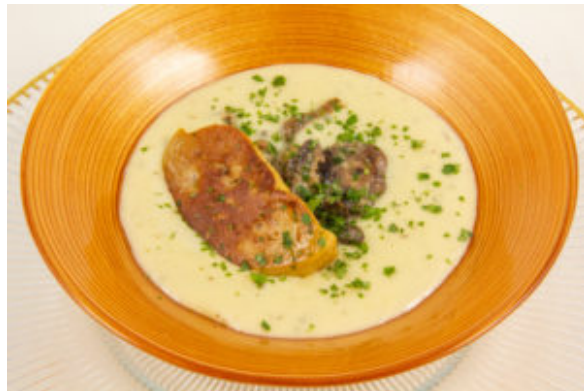
Cappuccino Pommes de terre, champignons et foie gras

En entrée: Cappuccino de pomme de terre, champignon et foie gras (la recette sera publiée le 8 décembre)