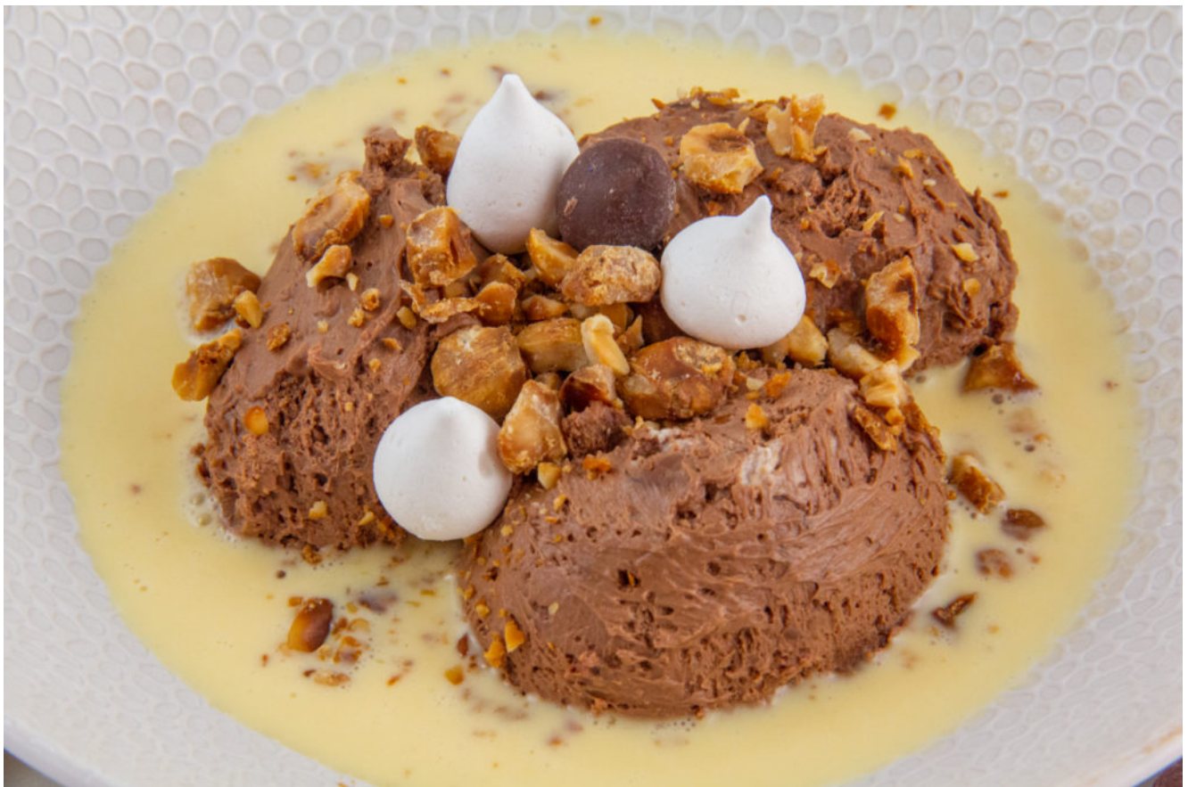
Ultra mousse au chocolat noisette