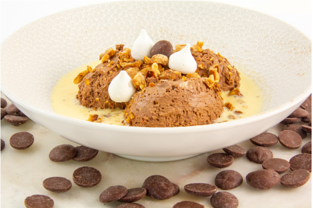
Ultra mousse au chocolat noisette