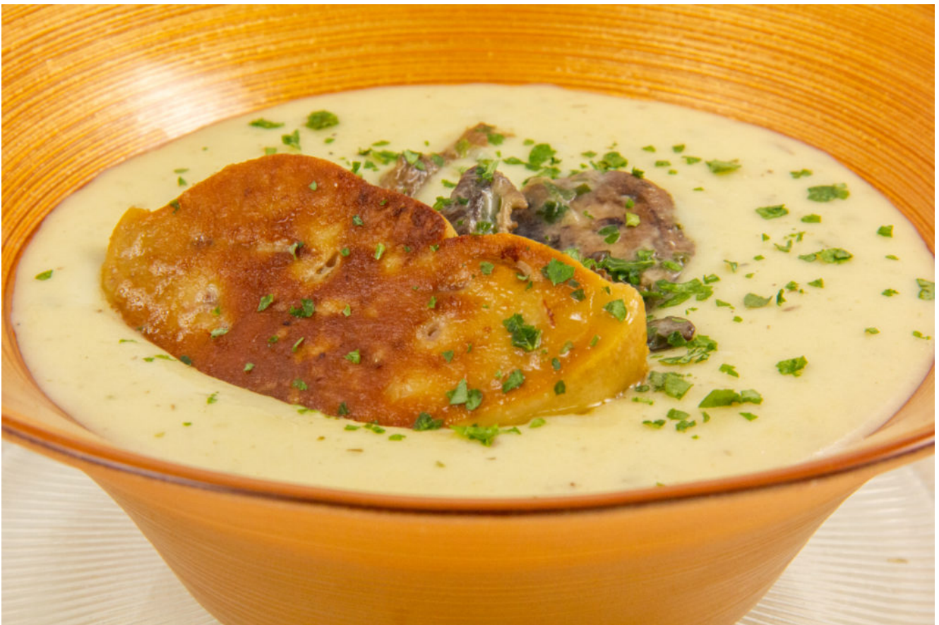
Cappuccino Pommes de terre, champignons et foie gras

Pour la recette adaptée au Thermomix cliquez ici