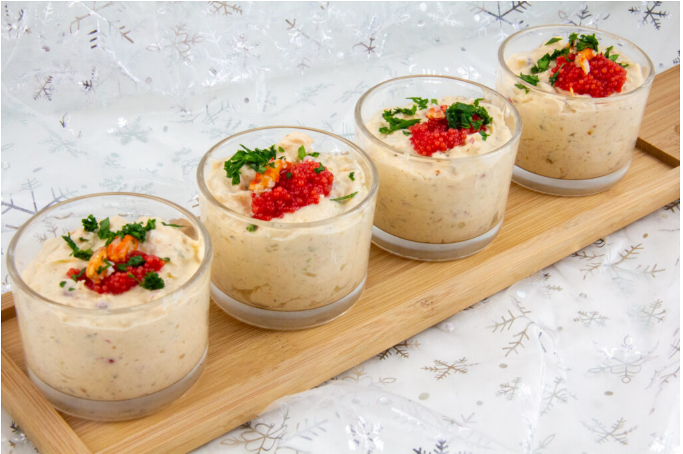
Verrine crabe et saumon