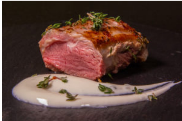
Agneau et sa crème d'ail (Recette TM6, cuisson sous vide)