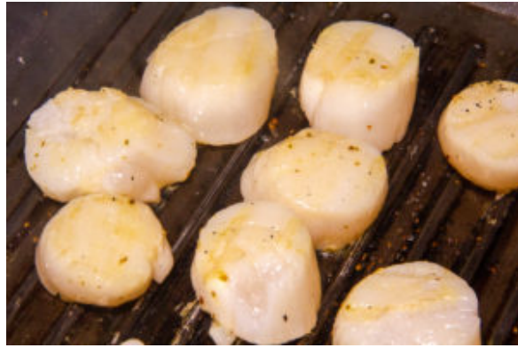
Cuisson des Saint Jacques