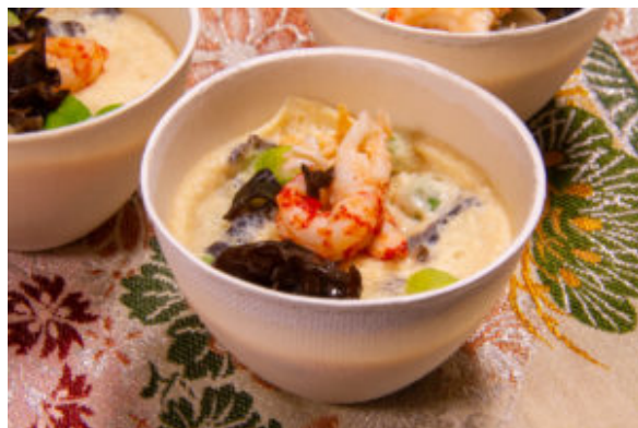
Chawanmushi ou petits flans salés japonais (recette Thermomix)