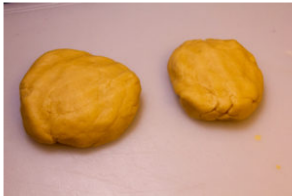
Façonnez deux pâtons