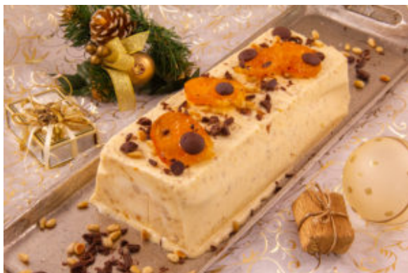
Nougat glacé de Noël

En dessert: Nougat glacé de Noël (la recette sera publiée le 1 décembre)