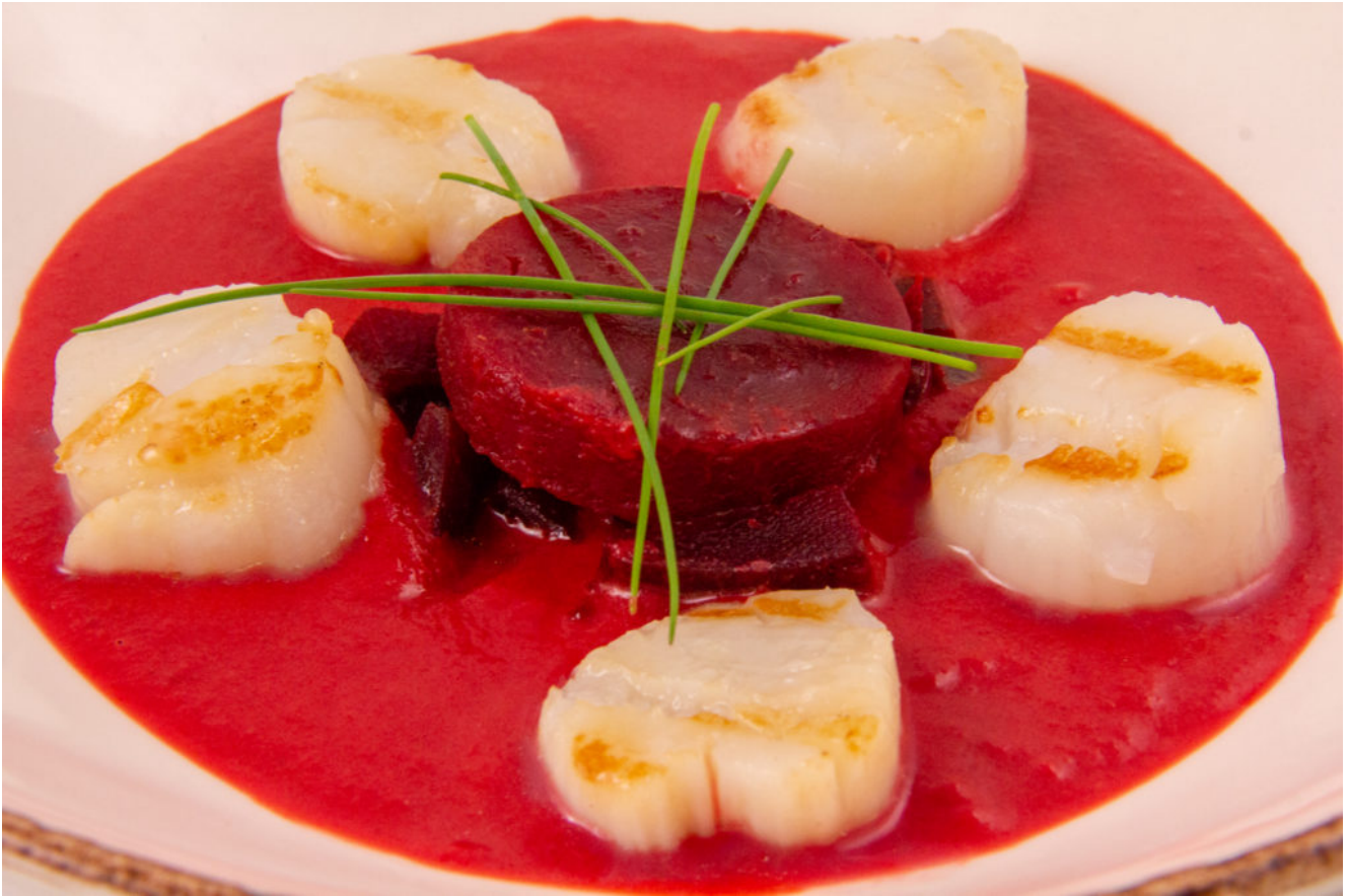
Saint Jacques en habit rouge