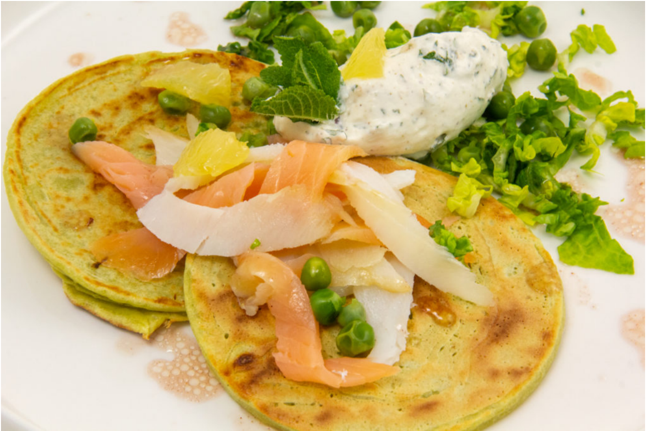
pancake petit pois, saumon, sauce menthe