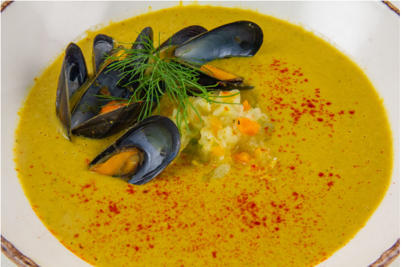
Velouté de moules au safran