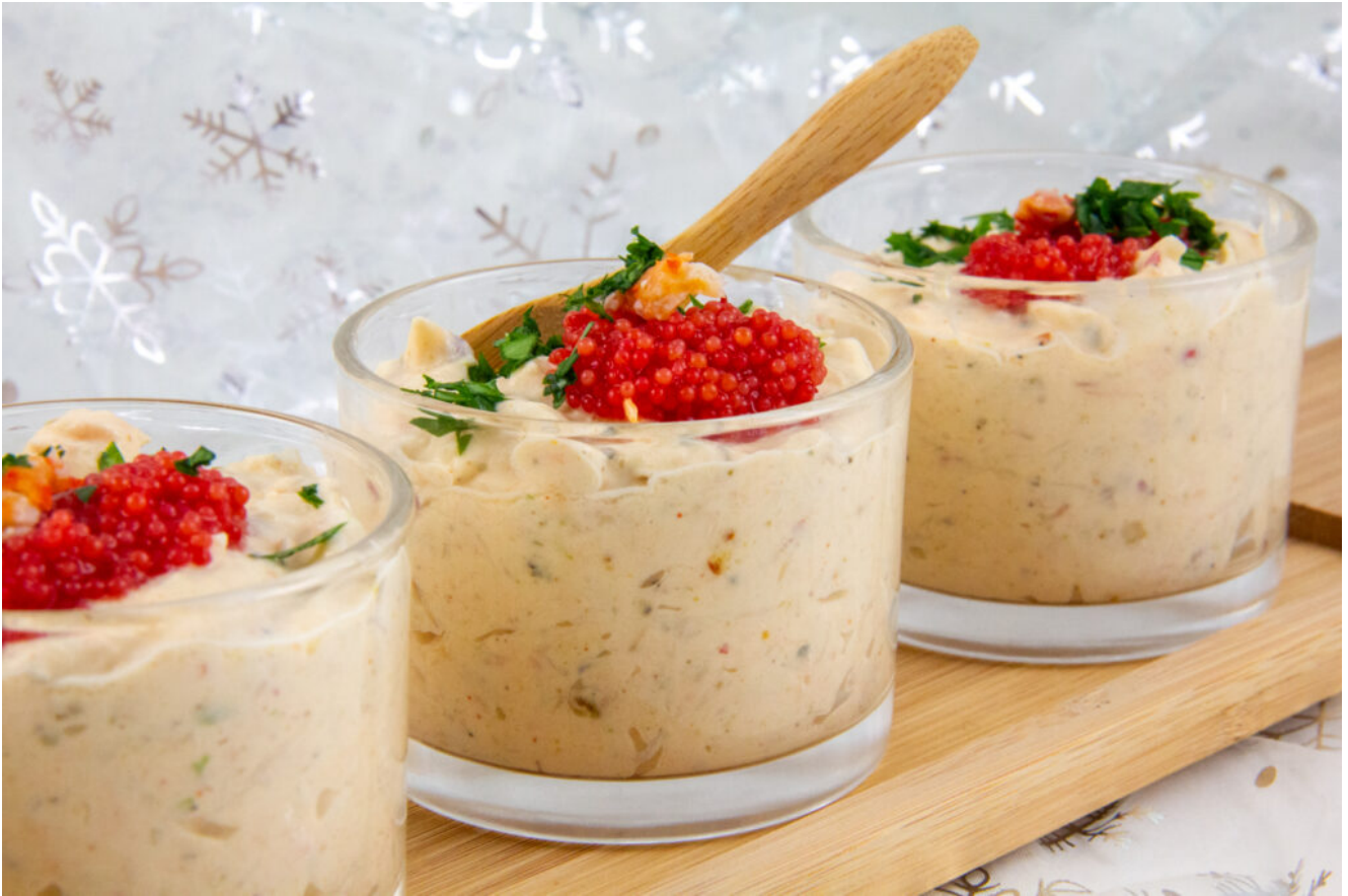
Verrine crabe et saumon

Et si vous êtes fatiguée des chips, tacos, cacahuètes, biscuits industriels, découvrez dans mon dernier livre mes recettes pour des mises en bouches variées, originales, exotiques, bref autant d'exquises petites préparations qui feront de votre début de soirée une véritable fête gourmande.