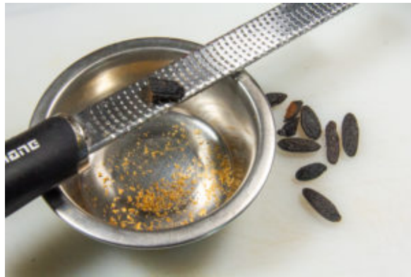
Râpez finement la fève Tonka