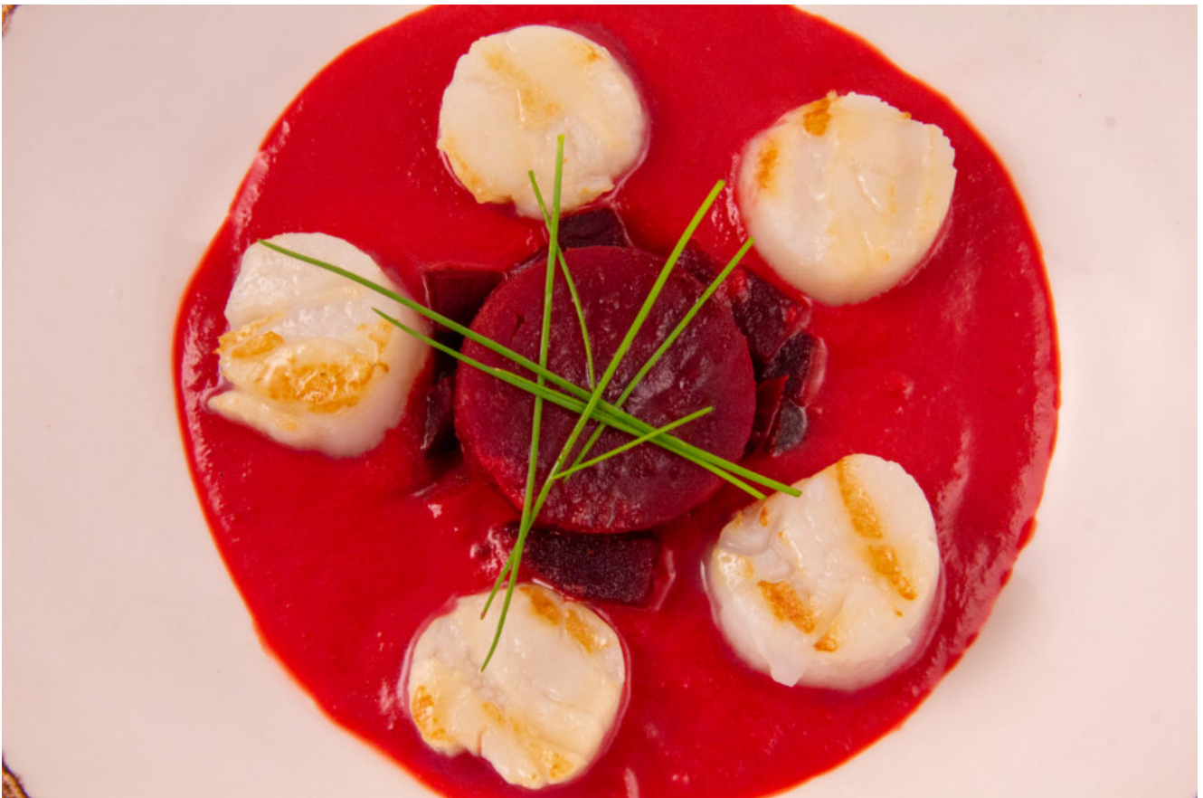
Saint Jacques en habit rouge