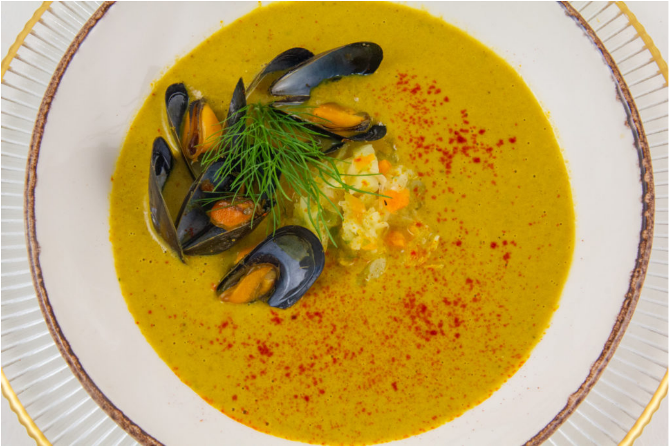
Velouté de moules au safran